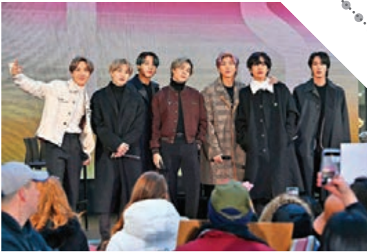
■防彈少年團近年來在全球人氣暴漲。

是日前今年發行的專輯中最高的首周銷量紀錄，更讓BTS成為了Billboard音樂榜歷史上首個有四張專輯奪得Billboard 200榜冠軍的韓國歌手。同時，防彈少年團也成為了繼披頭四樂隊後Billboard歷史上最短時間連續四張專輯奪得Billboard 200榜冠軍的歌手，成績相當驕人。