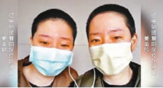
■黃渤鼓勵雙胞胎護士姐妹。