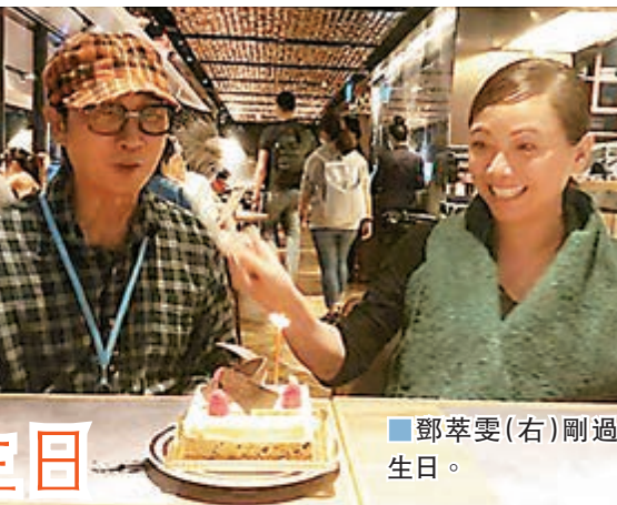
■鄧萃雯(右)剛過生日。

雯女還留言：「我一向都相信幸福快樂是通過努力和用心來獲得。昨天做了個有情人，因而大家都幸福滿溢，哈哈！劉松仁是我少年時代的電視劇偶像，我小時候他演過的《北斗星》《ICAC廉政公署》傳遞了正確的價值觀給我，讓我覺得演戲需要有使命感有社會責任，所以也是我演藝生涯中的人生導師和好朋友。」