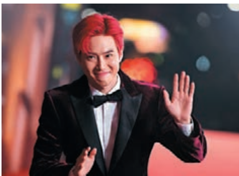
■金俊勉就為抗新冠病毒疫情，捐贈了5,000萬韓圓。資料圖片

香港文匯報訊 (記者 文芬) 據韓國媒體報道，金在中通過「希望橋」災害救助協會捐贈了3,000萬韓圓(約19.2萬港幣)後，又向歌迷捐贈了1,000萬韓圓(約6.4萬港幣)行善。最近，金在中的粉絲們決定捐贈口罩，以防止新冠病毒疫情擴散。但是，該捐贈賬戶上多出了以「金在中」名義滙入的1,000萬韓圓的款項，令粉絲們大吃一驚。其後，經理公司c-jes娛樂相關人士證實：「的確是金在中本人」，並解釋：「此筆款項是金在中得知粉絲們為了捐贈口罩而募集捐款後，為了幫助粉絲而滙入的。」