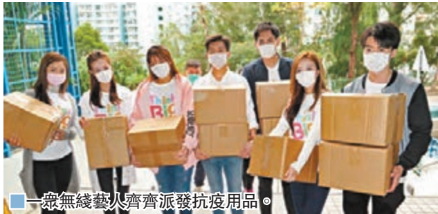
■一眾無綫藝人齊派發防疫用品。