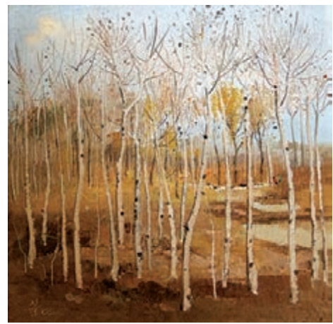
吳冠中作品《北國之秋》