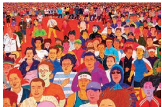
李宇城《People Running in Sweat》

展覽題目源自韓國詩人 Kim So-yeon 詩集《One-Word Dictionary》。當中有這樣一句：「A ring denotes a circle; to a boxer, however, it is a square.」「Ring」可譯為「環形」，亦可譯為「拳擊台」。試想像日常生活為一個圓形，當暴力出現，圓形就變成了一個環，包圍住各種暴力，就像正方形的拳擊台一樣。展覽利用「Ring」的兩個隱喻，試圖去呈現藝術家們於日常生活接觸暴力的時刻。是次展覽被韓國文化藝術委員會（Arts Council Korea）選出，曾於2019年在韓國仁沙藝術空間（Insa Art Space）展出。四位韓國藝術家金