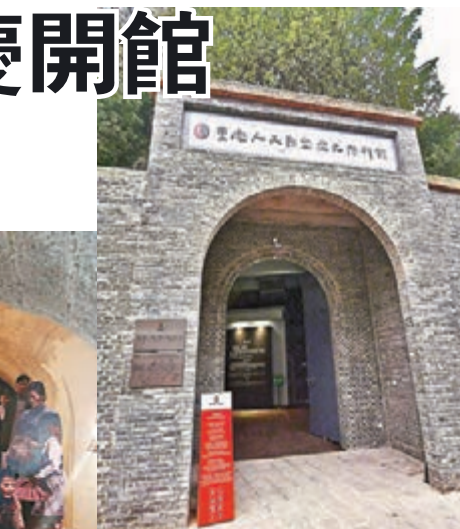
全國首座洞穴抗戰博物館防空陳列館近日開館。

「漢陽精造盡西遷，澗安機數里延。」這句話概括了重慶建川博物館的來歷。抗戰時期，這裡作為武器生產車間向前線輸送了幾十萬隻輕武器。新中國成立之後，這裡發展為國營建設機床製造廠（建設廠），繼續