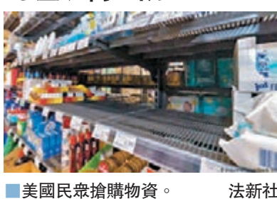
美國民眾搶購物資。