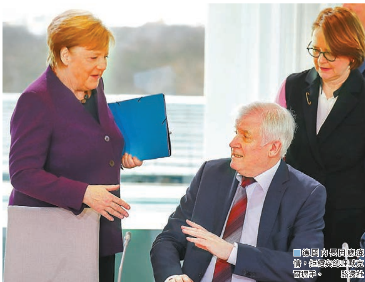
德國內閣因應疫情，拒絕與總理克爾握手。