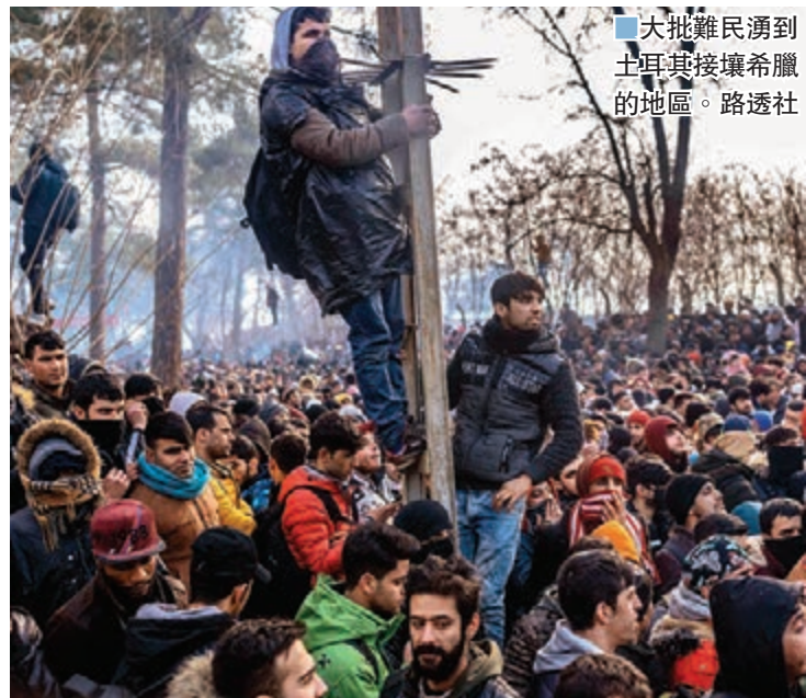
大批難民湧到土耳其接壤希臘的地區。