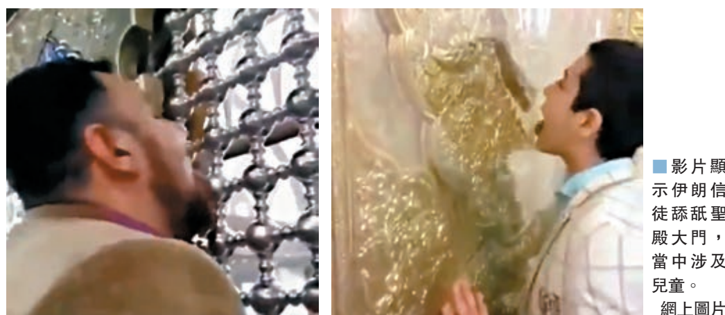
影片顯示伊朗信徒舔舐聖殿大門，當中涉及兒童。