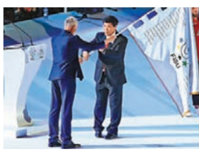
成都接棒那不勒斯，明年主辦大運會。資料圖片

2021年第31屆世界大學生夏季運動會(成都大運會)最終定於2021年8月16日至27日在成都舉行，這是繼2001年北京、2011年深圳之後，中國內地第三次舉辦世界大學生夏季運動會，也是中國西部第一次舉辦世界性綜合運動會。本屆世界大運會共設置18個比賽大項，包括射箭、籃球、排球等15個必選項目，武術、賽艇、射擊3個自選項目。屆時，將有來自170多個國家和地區的1萬餘名運動員、教練員、裁判員和相關國際體育組織官員等來蓉參會。 ■新華社