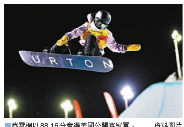
蔡雪桐以88.16分奪得美國公開賽冠軍。

另外，在德國阿爾滕伯格，2020年世界雪車錦標賽當地時間29日結束了女子鋼架雪車的比賽，中國選手林回央在4輪較量中分別位列第16名、第14名、第17名、第13名，最終以總成績3分59秒27獲得第13名，創造中國隊該項目的歷史最佳戰績。冠軍由27歲的德國選手赫爾曼獲得，她的成績為3分54秒52。 ■中新社