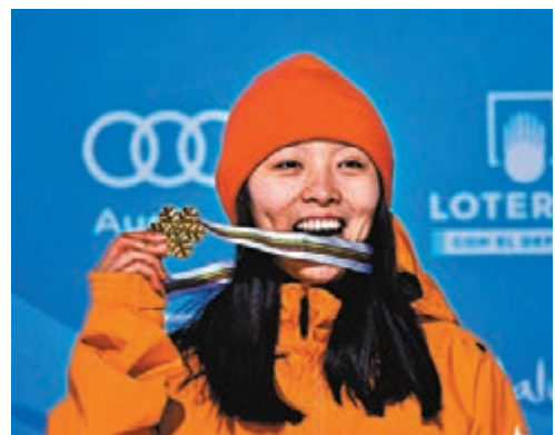
蔡雪桐今年表現亮眼，第6次獲得世界盃總冠軍。資料圖片

第38屆美國公開賽單板滑雪U型場地比賽當地時間29日晚在美國科羅拉多結束，中國選手蔡雪桐以88.16分奪得冠軍，這是中國運動員首次獲得是項公開賽金牌。