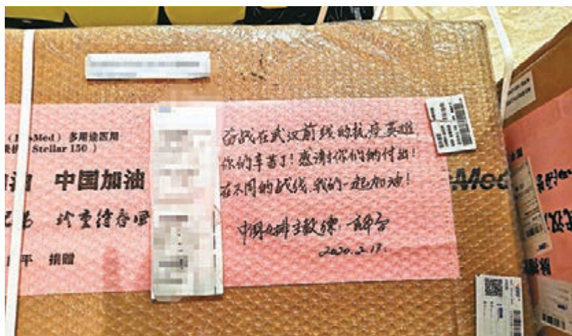
郎平向武漢捐贈物資。

此前，李娜、易建聯、傅園慧等名將紛紛為湖北獻出愛心，體育人一直在行動。 ■中新社