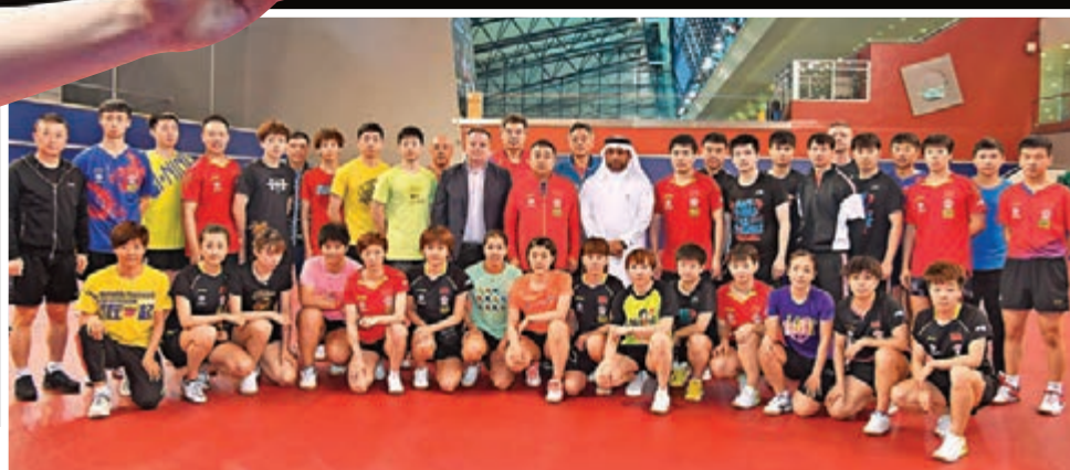
中國乒隊正在多哈集訓。ITTF圖片

國乒於1月26日大年初二前往柏林參加國際乒聯德國公開賽，一行包括運動員、教練、體能和隊醫在內共50人。但由於新冠肺炎持續，為了保障隊員的健康與安全，中國乒協臨時決定取消回國的計劃，在德國賽結束之後直赴卡塔爾集訓，並參加3月3日至8日舉行的卡塔爾公開賽。