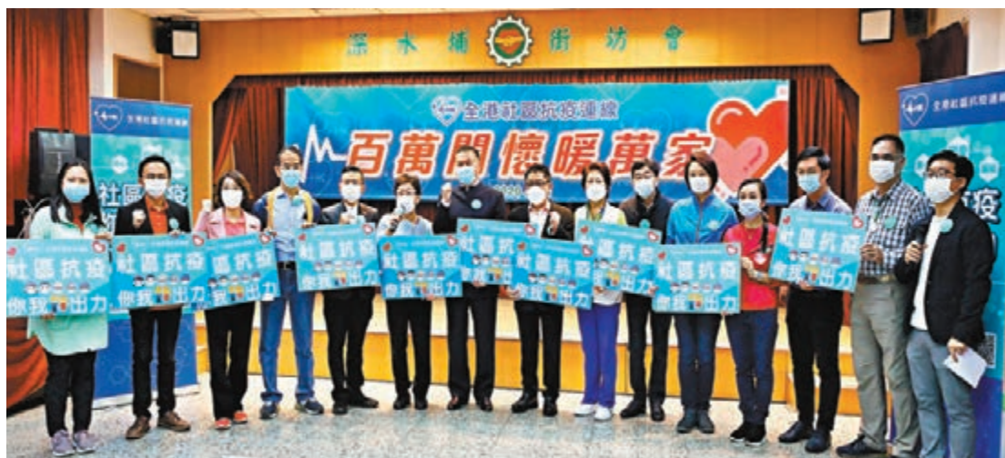
「全港社區抗疫連線」昨日於深水埗街坊福利會舉行「百萬關懷暖萬家」大行動啟動儀式。