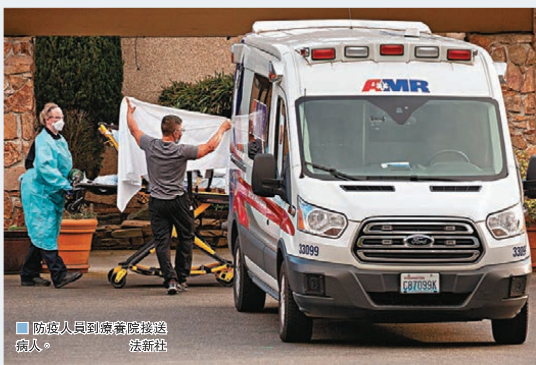
防疫人員到療養院接送病人。

美國前日出現國內首宗新冠肺炎死亡個案，患者來自華盛頓州，州內另一間療養院疑似出現集體感染，共有兩人確診和逾50人出現病徵，州長英斯利隨即宣佈華盛頓州進入緊急狀態。總統特朗普則召開記者會，呼籲國民不要恐慌，強調「美國境內確診個案不多」。另外，墨西哥上周五錄得3宗確診個案，特朗普表示正考慮關閉南部接壤墨西哥邊境，其後則稱「正檢視所有邊境」是否需要關閉。