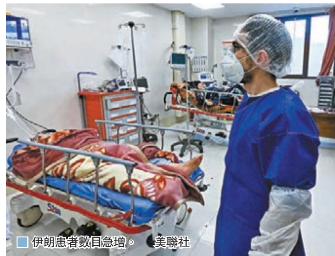
伊朗患者數目急增。