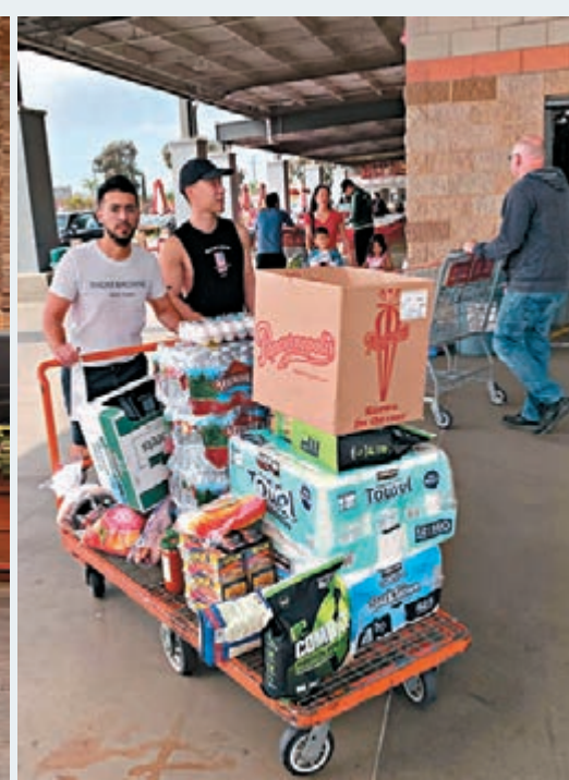
美國人到超市掃貨。

美國首宗死亡個案來自華盛頓州西雅圖近郊的柯克蘭市，死者是一名50多歲男性，原本已罹患其他疾病，他近期沒有外遊記錄，亦未有與確診者接觸，暫未知感染源頭。柯克蘭另一間療養院則確診兩宗新病例，其中一人是40多歲的女性員工，目前情況穩定，另一人是70多歲的女院友，現時情況嚴重。療養院內另有逾50名職員和院友出現呼吸道病徵，已安排進行病毒測試，預計會有更多確診個案。