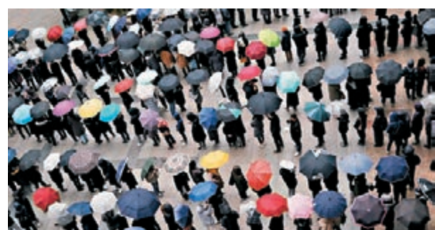
韓國一單難求，商店外築起人龍。

韓國的防疫物資包括口罩等供應緊張，教育部昨日宣佈，從全國中小學儲備的口罩中，撥出約一半供一般市民使用，以確保口罩供應穩定、防止新冠肺炎疫情進一步蔓延。不少學校對此表示不滿，指學校採購口罩如打仗般艱難。