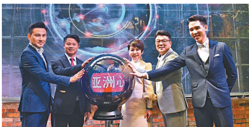
■「亞洲心動娛樂」媒體發佈會日前在吉隆坡舉辦。

據悉，除了香港，亞視宣佈接下來會投放更多時間、資源於其他亞洲地區，包括馬來西亞、新加坡和台灣，在亞洲心動娛樂的企劃下，未來會在馬來西亞打造影視城，持續招募各國的優秀創作團隊合作，將四大區域的資源、觀眾進行整合，進一步開發更大的市場。