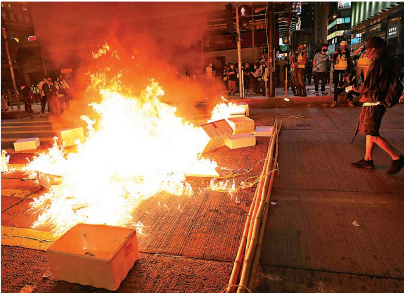
■黑衣魔再借「8·31」謊言搞破壞，糾眾在旺角縱火焚雜物。