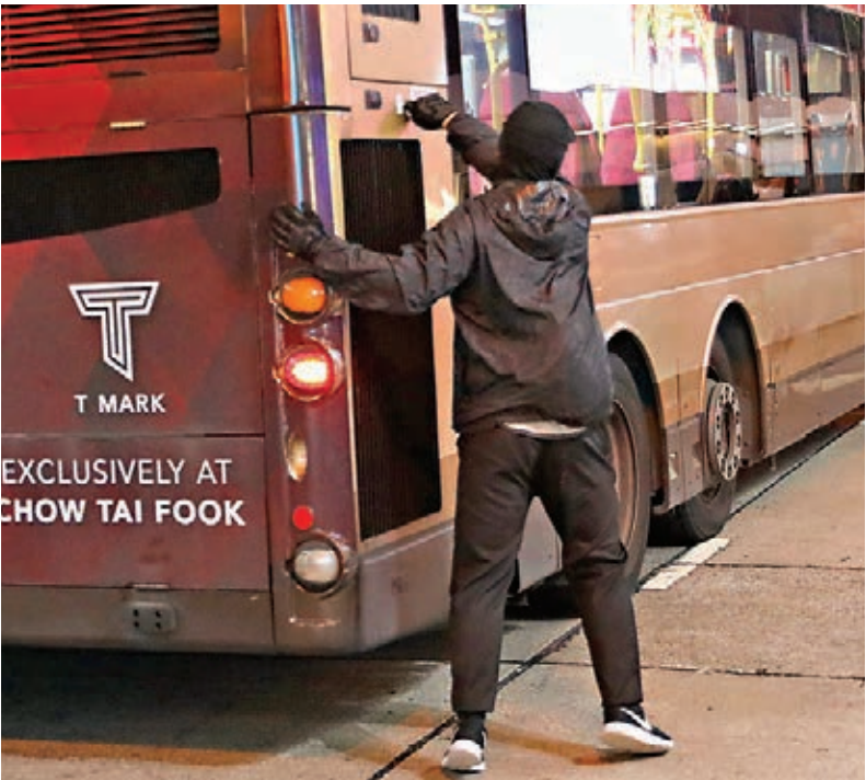
■暴徒破壞路經巴士。