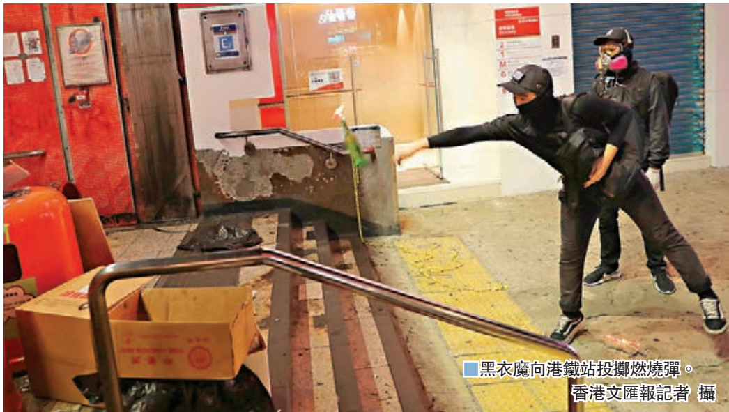
■黑衣魔向港鐵站投擲燃燒彈。