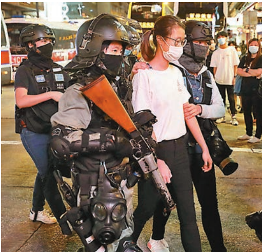
■一名女子被防暴警帶走。

警方西九龍總區指揮官陶輝親自督師。防暴警分別向深水埗方向和尖沙咀方向追捕黑衣魔，群