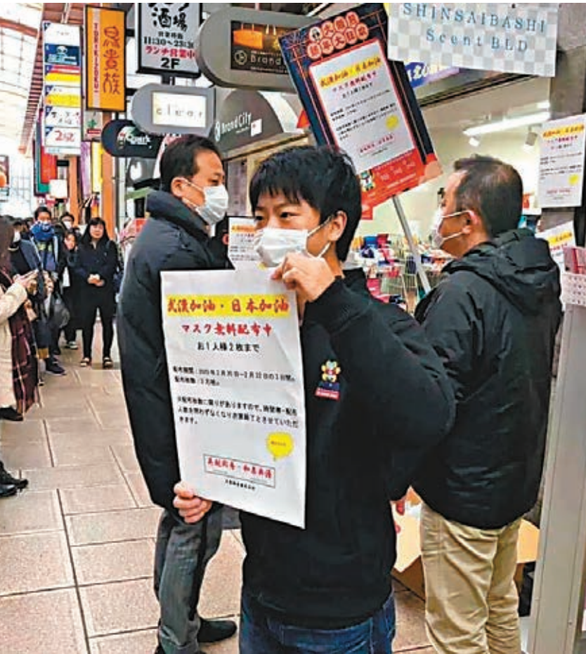
■一家名為「大阪熊」的藥妝店門口打出了「吳越同舟，和衷共濟」的海報。