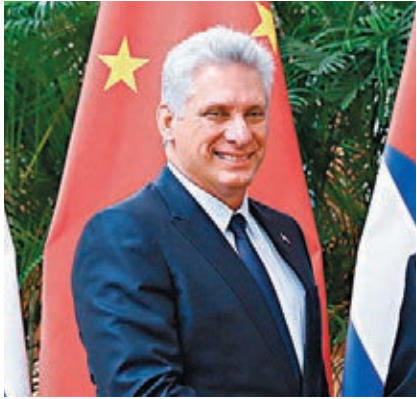
■迪亞斯-卡內爾 資料圖片

習近平指出，新冠肺炎疫情發生後，勞爾第一書記和你在第一時間向我致電表示慰問，你還專程赴中國駐古巴使館表達對中方的支持，這充分體現了中古