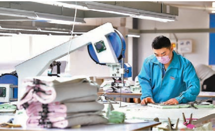
■在河南省台前縣清水河鄉清東村，務農農民在一個精準扶貧就業基地切割內衣布料。

史秉銳表示，河南53個貧困縣全部脫貧摘帽是河南脫貧攻堅戰的一項重大成果，是河南脫貧歷程上的一個重要歷史節點，標誌着河南由此進入