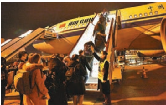
■國航「成都—法蘭克福」復航首航班機從雙流國際機場升空直飛歐洲。圖為旅客登機中。

中航集團還介紹，復航首班的法蘭克福航班實現配送本地貨物17票共約8噸「成都造」電子產品，另有外地經成都中轉歐洲貨物9噸。同時，利用法蘭克福機場歐洲航空樞紐的優勢，此次回