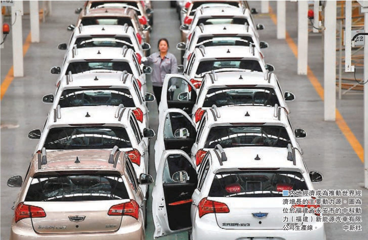
■內地經濟成為推動世界經濟增長的主要動力源。圖為位於福建省永安市的中科動力（福建）新能源汽車有限公司生產線。

盛來運還表示，過去一年，內地基礎設施建設成績斐然。2019年末，高速鐵路營業總里程超過3.5萬公里，佔全球高鐵路程2/3以上；高速公路里程超過14萬公里，穩居世界第一。2019年郵政行業業務總量達到16,230億元人民幣，比上年增長31.5%；快遞業務量635.2億件，增長25.3%。2019年移動互聯網用戶接入流量比上年增長71.6%。5G商用穩步推進，大數據、雲計算、人工智能等現代信息技術快速發展。