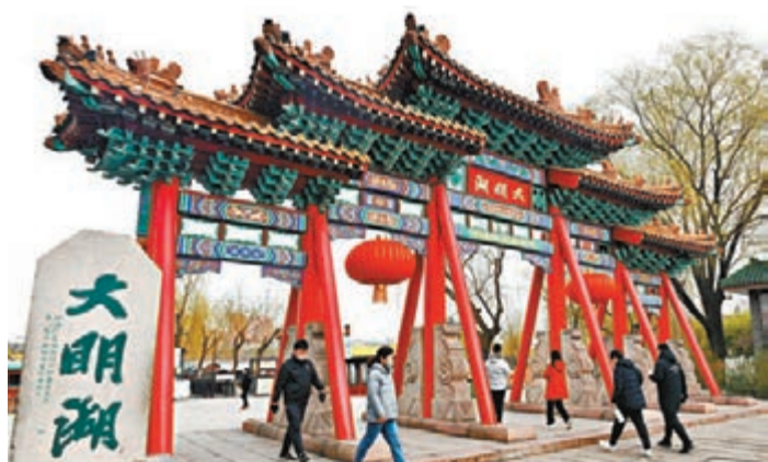
■山東濟南包括趵突泉、大明湖等景區恢復開放，每日客流量控制在最大承載量的50%以內。