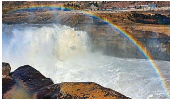
■陝西黃河壩口瀑布景區實行網絡實名制預訂售票，分時段安排團隊遊客間隔入園。