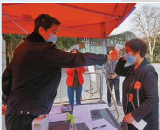
▲工作人員為進入廣西桂林象鼻山景區的遊客先進行體溫登記。