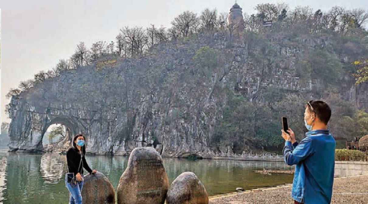
▶象山景区為廣西桂林有序開放的首個景區，遊客在象鼻山前拍照留念。

截至2月24日，全國景區開園率是38.1%，除黃山、九華山以外，杭州西湖、靈山大佛、周莊、同里古鎮、千島湖、婺源、紹興沈園、龍門石窟及海角天涯等也均於2月19日起陸續開放，覆蓋浙江、江蘇、江西、四川、安徽、河南、廣西及海南等多個省份。