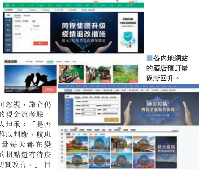
■各內地網站的酒店預訂量逐漸回升。

「我們要有最強的危機意識。」景域驢媽媽集團董事長洪清華說，此刻應馬上更堅決縮減一切可能的費用、剝離不良業務、杜絕虧損及沒有質量的增長，確保現金流，同時要確保競爭力。攜程聯合創始人、董事局主席梁建章認為，旅遊業韌性是非常強，不會發生不可逆轉的變化。