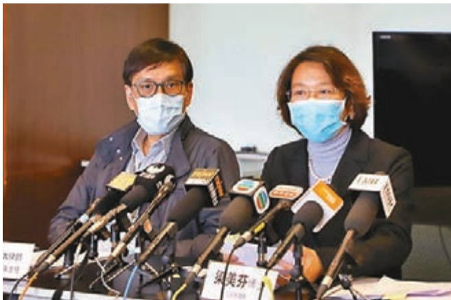
■ 梁美芬（右）與束健銘指會跟進個案。

香港文匯報訊（記者 鄭治祖）網絡部分與新冠肺炎相關的歌曲針對不幸患病的警員。一直跟進有關網上欺凌事件的經民聯立法會議員梁美芬昨日表示，該網上歌曲的內容或已觸犯《殘疾歧視條例》，將協助相關警員入稟區域法院進行民事訴訟。