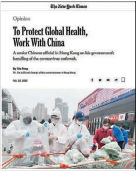
▲ 謝鋒在《紐約時報》發表題為《與中國攜手 守護全球公共衛生安全》的文章。 ▶ 謝鋒(左四)代表接受陳守仁向湖北紅十字會的100萬美元捐款。

香港文匯報訊 據中國外交部駐港特派員網站載，外交部駐港特派員謝鋒昨日發表署名文章，介紹中國抗擊新冠肺炎疫情所取得的積極進展，並強調要打赢這場抗疫阻擊戰，必須同舟共濟；必須尊重科學、尊重事實；必須摒棄意識形態偏見和冷戰思維，「讓我們超越社會制度、歷史文化和發展階段差異，共同守護好榮損與共的地球村，構建中國國家主席習近平倡導的人類命運共同體。世界好，中國好；中國好，世界更好。」（全文刊A17評論版）