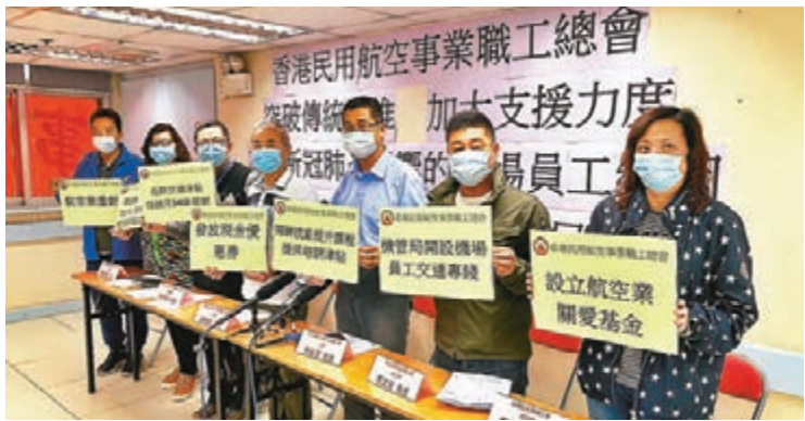
■ 民用航空事業職工總會促政府和機管局「開倉賑災」。

的抵港航班就由每日35班大幅縮減至每日兩班；平日寄倉行李數量約8萬件，現減至不足兩萬件，飛機餐由平日3萬多份減至現在少於1萬份，更有外判廚房工人因而被解僱。 張樞宏估計，航空業界目前有近80%員工被迫放無薪假，以平均放12日計算，各員工變相減薪兩至三成，難以維生，部分人考慮轉行，將令航空業界人才流失。 他認為，特區政府早前推出的抗疫基金未有惠及航空業，建議特區政府針對業界推出紓困措施，包括為機場員工發放現金優惠券、成立「航空業關愛基金」、開設機場員工交通專線、為放無薪假機場員工開設一些技