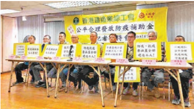
■ 建造業總工會呼籲向所有已經在建造業成功登記註冊的建造業工友發放補助金。