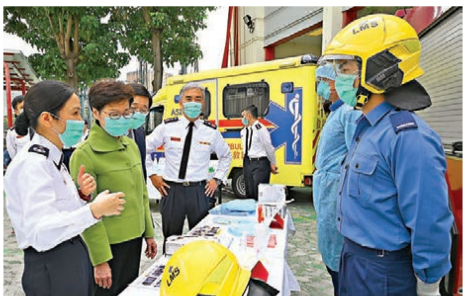
行政長官林鄭月娥(左二)在保安局局長李家超(左三)和消防處處長李建日(左四)陪同下，聽取消防處副救護總長曾敏霞(左一)介紹前線人員的個人防護裝備。

她讚揚消防和救護人員以救急扶危為己任，在壓力下勇敢及專業地服務市民，並強調政府會優先分配防疫物資予醫護及包括消防和救護人員在內的前線同事，讓他們安心工作，又感謝消防處理職和退休人員積極參與抗疫情的義務工作，在疫情中與市民同舟共濟。