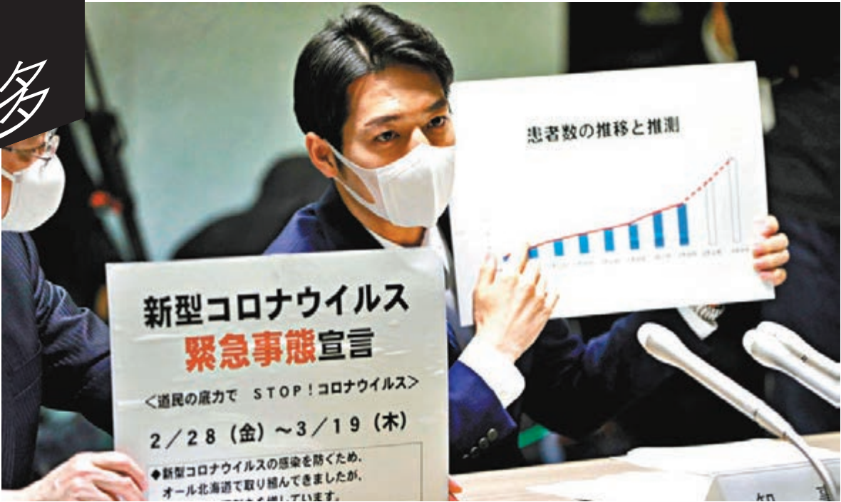
■鈴木直道手持數據，呼籲民眾周末留在家中。