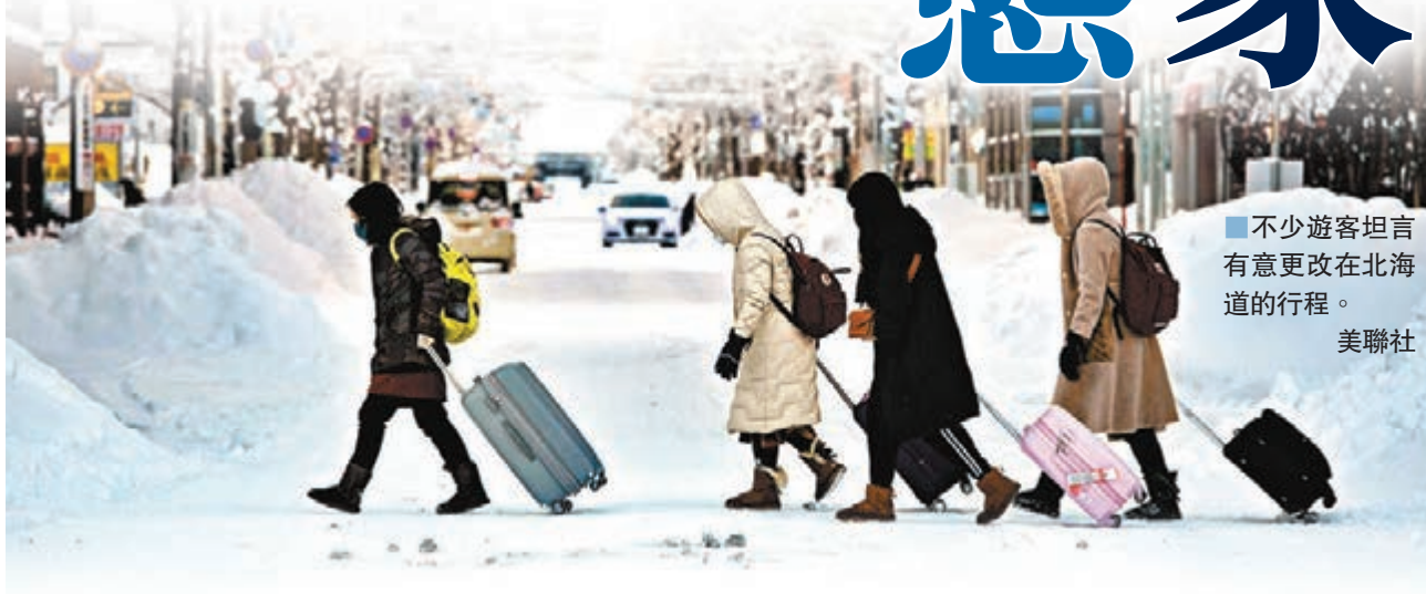
■不少遊客坦言有意更改在北海道的行程。

日本全國截至昨晚8時30分，已錄得936宗感染個案，當中705宗來自「鑽石公主號」郵輪，死亡人數則為11人，其中一名「鑽石公主號」新增死者是英國人。內閣官房長官菅義偉表示，會鼓勵公共機構和私營企業配合政府防疫方針，讓僱員可在家工作。財相麻生太郎稱，政府正審視向家庭提供財政支援。安倍今晚會再召開記者會，交代抗疫事宜。 ■綜合報道