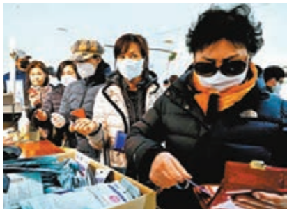
■韓國民眾到商店購買口罩。

所，國民可留在車內，打開車窗接受體溫檢查及樣本採集，節省當局搭建帳篷進行消毒及通風的時間，並提高採集樣本效率至每小時6個，是普通篩查診所的3倍。