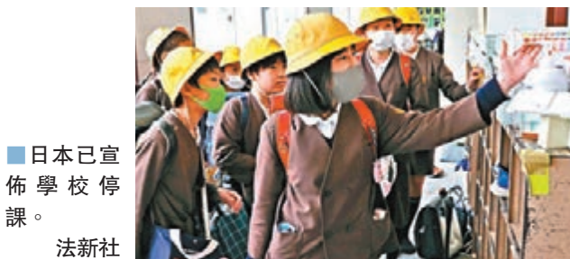
■日本已宣佈學校停課。

日本新型冠状病毒疫情持續蔓延，錄得最多感染個案的北海道昨日發佈為期3周的「緊急事態宣言」，要求當地500萬名居民盡量留在家中，尤其在今明兩日更應避免外出，以阻止感染擴大，保障居民安全 and 健康。