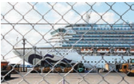
新確診患者為「鑽石公主號」旅客，後乘搭首班飛機回港。資料圖片

香港文匯報訊(記者 文森)香港昨日再新增一宗新冠狀病毒肺炎確診個案，患者為早前乘飛機由日本返港的「鑽石公主號」郵輪乘客，本港累計個案總數增至94宗。醫院管理局已決定擴大「加強化驗室監察計劃」，未成年及醫生有懷疑的病人有需要時亦可進行深喉唾液檢驗，以及早找出新肺炎患者。