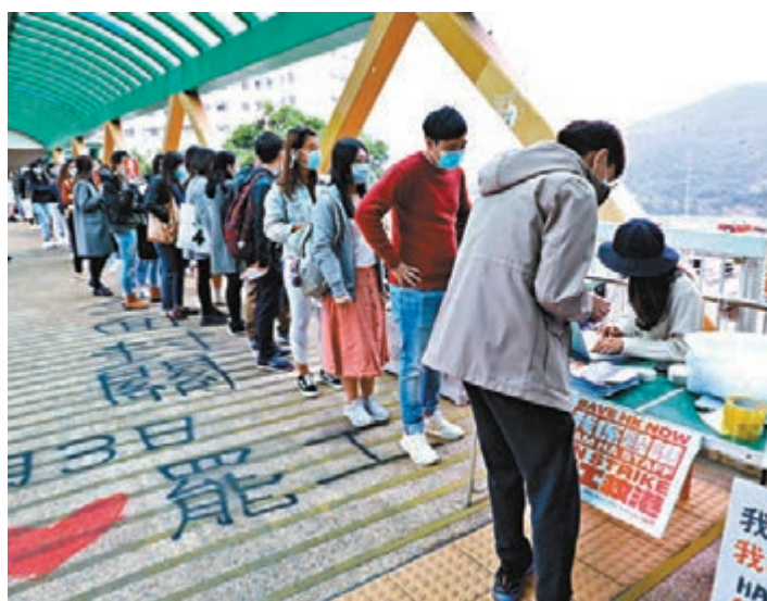
高拔陞解釋由於須向員工支付今個月薪金，故有需要在發薪前了解員工缺勤的原因。

食物及衛生局局長陳肇始表示，留意到醫管局員工對信件的反應，並重申政府非常關心醫護人員，會盡力提供足夠資源及防疫物資，但她不認為目前有任何證據顯示有秋後算賬的情況，相信醫管局會按既定的人事處理機制，公平、公開地處理事件。她希望在疫情下大家齊心一起抗疫。