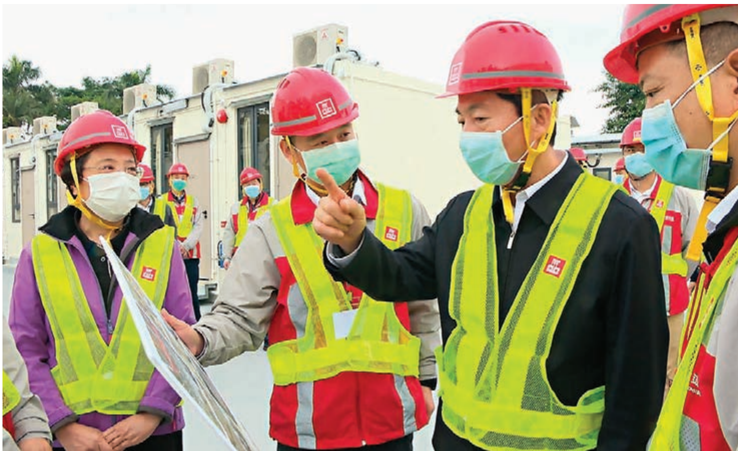
駱惠寧在現場看望慰問工程建設者。他充分肯定中建國際高質量推進專案建設。

據了解，因應疫情持續發展，香港特區政府徵用鯉魚門公園度假村作為緊急防疫觀察隔離中心，共計352個隔離單位。昨天落成的A區專案118個單位，從開工到建成，僅花了28天時間，比原計劃提早4天。A區專案已於昨日下午交付於特區政府有關部門。