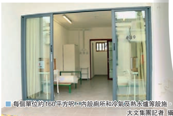
每個單位約160平方呎，內設廁所和冷氣及熱水爐等設施。