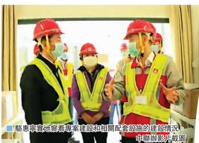
駱惠寧實地察看專案建設和相關配套設施的建設情況。