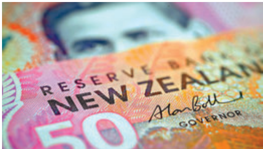
圖為新西蘭貨幣。

準。上方阻力預估在99.30及100關口。 美元兌日圓在近日亦見連番回挫,並且同樣在圖表可見MACD指標剛跌破訊號線,均示着美元兌日圓有回弱傾向,當前值得留意的是25天平均線,自2月5日以來,匯價屢次下探25天平均線亦力保不失,而至今匯價又再下探目前位於109.85的25天線,若此趨失守料美元兌日圓將迎來又一波下滑,下探支撐先為自一月以來的上趨向線位於108.95,下一級參考為1月底低位108.30。至於阻力則回看111及111.70水準。