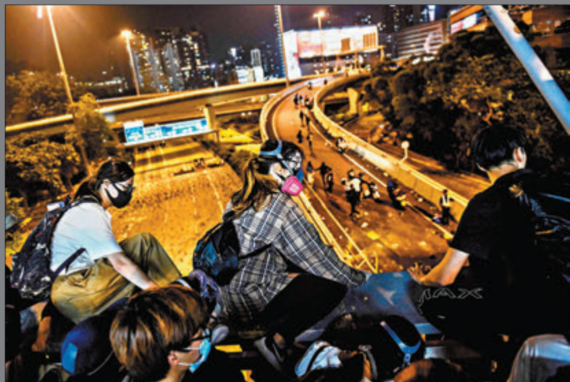
負責接載示威者離開的「保母車」司機有人成為被呢錢的受害者。資料圖片