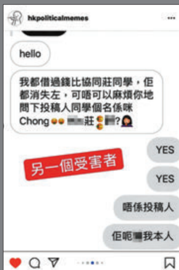
事件曝光後，有大批苦主聲稱被莊姓同學欺騙。網上截圖