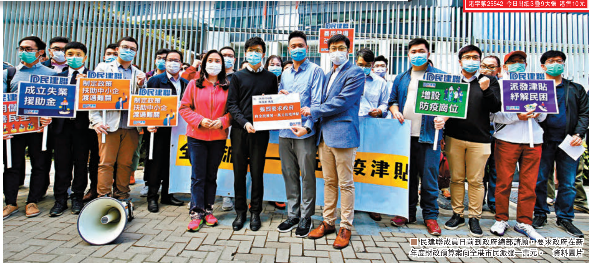
民建聯成員日前到政府總部請願，要求政府在新年度財政預算案向全港市民派發一萬元。資料圖片