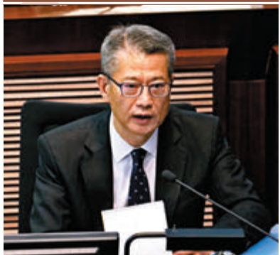
陳茂波昨日在立法會就新年度財政預算案作出簡報。

公民黨魁楊岳橋此前聲稱，不滿警隊大幅增加預算，並威脅稱特区政府不削減警隊開支，公民黨就不會支持預算案。「議會陣線」及工黨的張超雄等，亦聲言會否決預算案。