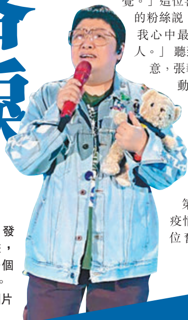
韓紅近日發文吐露心聲, 指出抗疫一個月甘苦自知。

韓紅又公佈, 截至目前(2月25日)在途物資情況: 1. 飛利浦無創呼吸機V60: 6台; 2. 飛利浦呼吸機 DreamStation AVAPS30AE: 6台; 3. 護舒寶安心褲: 30,000包; 4. 護目鏡60,000副。