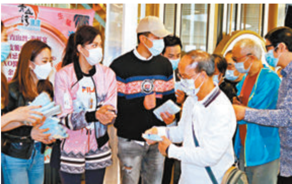
一眾藝人向一千位長者免費派發一萬個口罩。