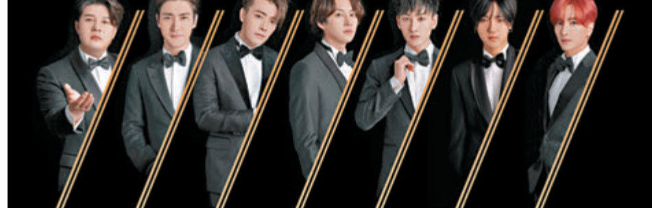
Super Junior (SJ) 演唱會受疫情影響而押後。

此外, 由於新冠肺炎疫情繼續在各地肆虐, 其中韓國更是重災區之一, 港府日前下令暫時拒絕從韓國抵港的非香港居民入境, 令原定於下月底在港舉行巡唱的韓國男團Super Junior也受影響。主辦單位昨發出延期舉辦公告, 指: 「因新型冠狀病毒肺炎疫情的影響, 現決定原定於2020年3月28日在亞洲國際博覽館-Arena舉辦的《SUPER JUNIOR WORLD TOUR - SUPER SHOW 8: INFINITE TIME in HONG KONG》將會延遲舉行。具體演出時間將另行通知。對於等待是次演出已久的粉絲及觀眾, 深感抱歉! 期望疫情可以盡快得到控制, 令大家可以再次欣賞Super Junior的精彩演出。」