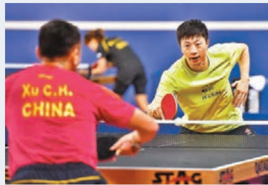
中國乒隊現在在卡塔爾集訓。

香港文匯報訊（記者 陳曉莉）世界乒乓球團體錦標賽延期，令自2月初結束德國公開賽後一直在海外訓練的中國乒乓球隊（國乒）陷入不知何處去的困境，有內地傳媒甚至形容為「流浪地球」。國乒於1月26日大年初二前往德國參加國際乒聯公開賽，包括運動員、教練、體能和隊醫在內共50人。但由於新冠肺炎持續，為了保障隊員的健康與安全，中國乒協臨時決定取消回國的計劃，在德國賽結束之後直赴卡塔爾集訓，並參加3月8日揭幕的國際乒聯卡塔爾公開賽。然後直接移師韓國，參加在釜山舉行的世乒賽。至於世乒賽之後，韓國及日本乒協都向國乒伸出友誼之手，邀請國乒留在當地備戰東京奧運會。不料，隨着日韓疫情的不斷升級，國乒海外集訓前景未卜，到底是留在卡塔爾，還是前往其他地區，成為放在國乒面前急需解決的難題。