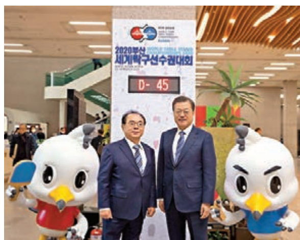
韓國總統文在寅（右）較早前親自視察世乒賽籌備情況。

新冠肺炎疫情在韓國愈演愈烈，截至昨日上午，韓國境內感染新冠肺炎人數已達到893人。為了確保所有參賽隊人員以及進場觀看比賽球迷的安全，國際乒聯昨日宣佈原定於3月22日至29日在韓國釜山舉行的2020世界乒乓球團體錦標賽將延期至6月21日至28日舉行，由於延期後的團體世乒賽日程與韓國及澳洲公開賽撞期，國際乒聯現正與兩站賽事的組委會討論商定重新排期。早前於匈牙利公開賽勇奪一金一銀的港隊原定參加下月的卡塔爾公開賽後轉戰世乒賽，希望爭取更高的奧運排名，不過今次由