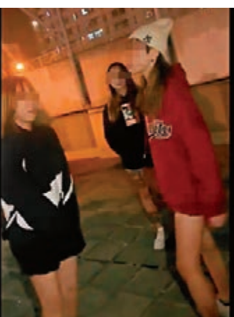
紅衣女狂打受害人耳光。

兩少女其後輪番對受害人瘋狂拳打腳踢，包括猛踢少女後腦、腰，又扯住受害人頭髮，又迫使受害人大聲道歉。「牛丸」又故意用腳擦高受害人短裙，另一少女則用手機距離拍攝受害人私處，畫面外有少年起哄：「有福利啊！」有人稱：「好啦