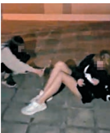
扯高受害人短裙拍私處。