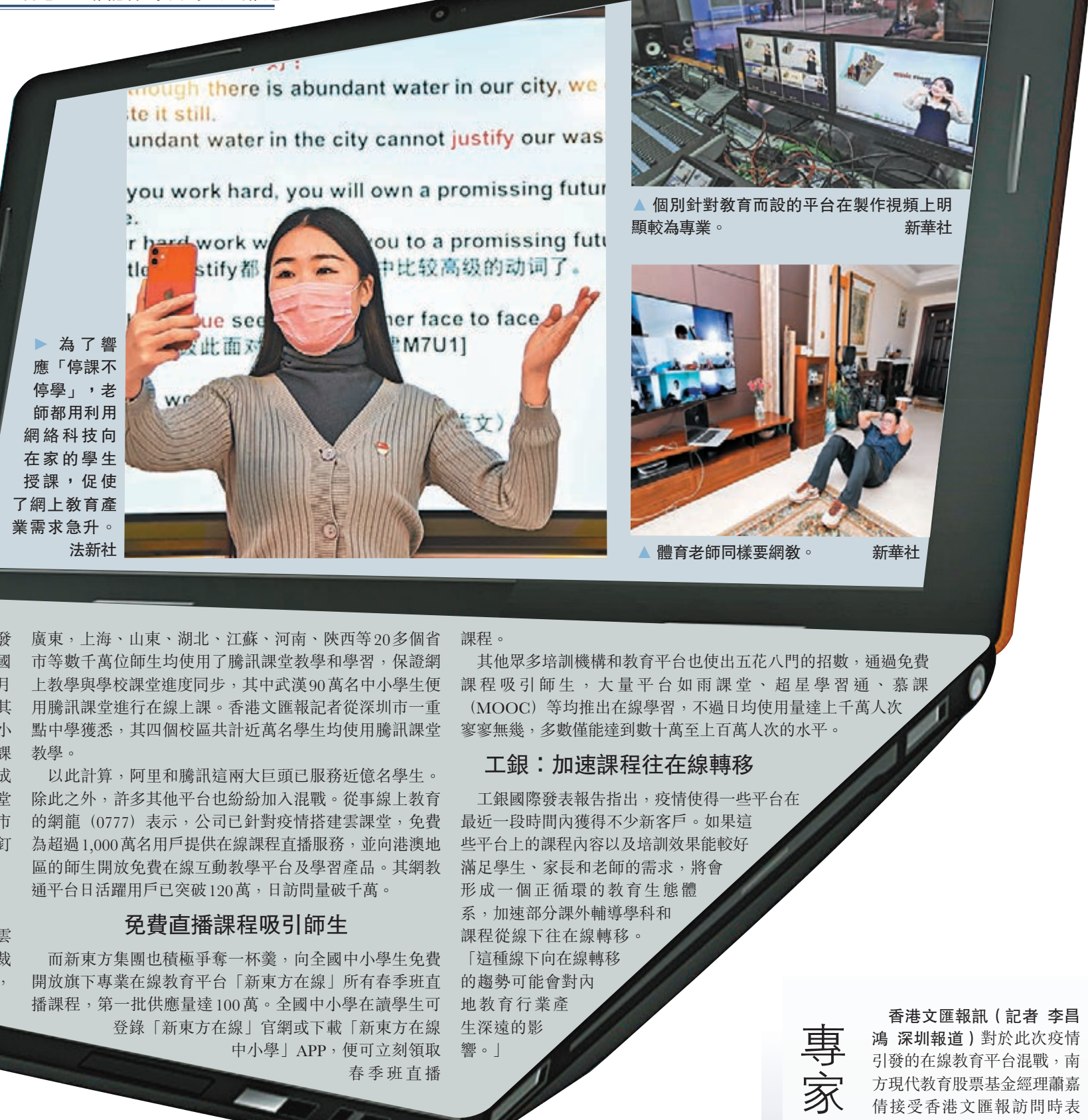
個別針對教育而設的平台在製作視頻上明顯較為專業。