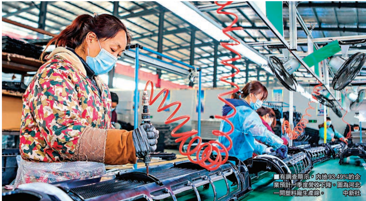
■有調查顯示，內地93.49%的企業預計一季度營收下降。圖為河北一間塑料廠生產線。 中新社

香港文匯報訊（記者 朱燁 北京報道）中國中小商業企業協會日前發佈調查報告顯示，企業營收減少、運營成本壓力增大以及市場萎縮成疫情爆發後內地企業的三大表現。投入產出比例是當前企業面臨的最大挑戰，企業資金鏈條存在斷裂的風險。該調查顯示，在未全面恢復開展業務期間，內地93.49%的企業預計一季度營收下降，平均降幅將達47.02%。