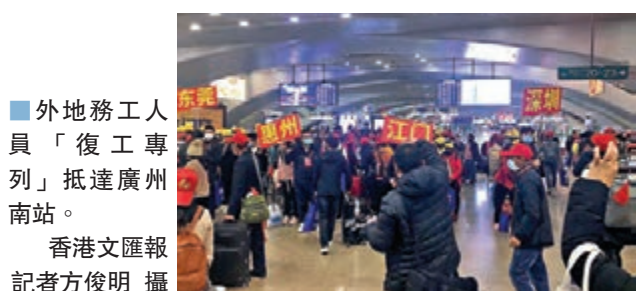
■外地務工人員「復工專列」抵達廣州南站。

隨著復工客流不斷入粵，廣東工業企業復工率逐日大升。據廣東省工業和信息化廳數據，全省規模以上工業企業復工，從2月13日的1.2萬家左右，到17日增至約2.62萬家，再到目前超過4.2萬家，復工率達82%以上。其中，「製造業大市」東莞規上工業企業復工率超83.3%，外資企業進出口300強開工率達91%。