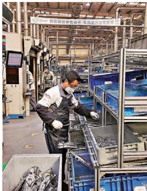
■延鋒安道拓上海區域工廠已完全復工。

香港文匯報訊（記者 倪夢環 上海報道）受疫情影響，內地出台多政策扶持企業支持復工，企業復工率亦不斷上升。僅在上海，外資重點服務企業復工率已達90%以上，外企超123億元（人民幣，下同，約合139億港元）的融資需求亦已經落實。而對於在中國的發展以及中國市場的預期，不少企業直言「有信心」，尤其對於企業未來智能化發展亦將不斷推進。