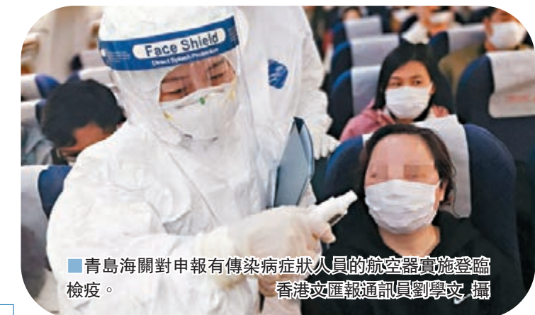
青島海關對申報有傳染病症狀人員的航空器實施登臨檢疫。