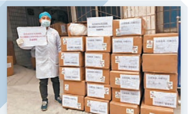
捐助防護 疫症當前，更需要大家不分彼此守望相助。香港宜昌聯誼會早前籌集了1,300件醫用防護服，昨日寄抵宜昌市中心人民醫院，冀助當地醫院做好新冠肺炎的防治工作。該院感謝香港宜昌聯誼會的愛心援助，並表示會根據醫療防護用品標準等具體情況，將收到的物資用於合適的科室和崗位。 文：香港文匯報記者 甘瑜

對於有人質疑滯留湖北港人應該為自己的選擇負責，袁國勇則以「癮君子」作為例子，指醫生明知「癮君子」做錯，都要醫治他們。