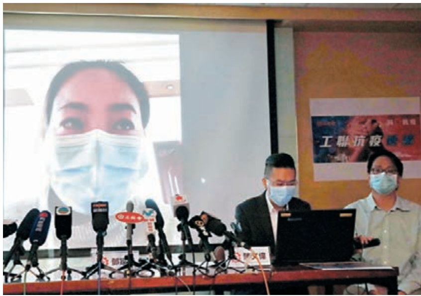
▲滯留湖北的港人在視像通話中表示，得知港府安排包機後非常開心。

同日，工聯會宣佈，自接受香港特區政府委託、義務協助受疫情影響而滯留在廣東和福建省的港人郵寄醫生處方藥物以來，短短兩天已接獲465宗市民的查詢和登記。工聯會將盡快開展郵寄藥物行動，及時將藥物送到市民手上，以舒緩滯留內地港人缺藥的燃眉之急。