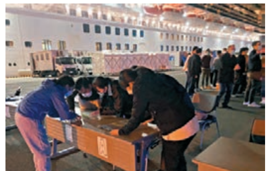
▲▲外交部駐港公署赴日工作組在橫濱碼頭協助「鑽石公主號」郵輪香港同胞返港。

組實施接返打下了良好基礎。如果沒有中央政府和外交部的全力支持，接返行動不可能順利完成。很多郵輪上的香港同胞對平安順利回到香港感到很激動，對中央政府、特區政府、駐港公署、駐日使館所做的大量工作表示由衷感謝，以