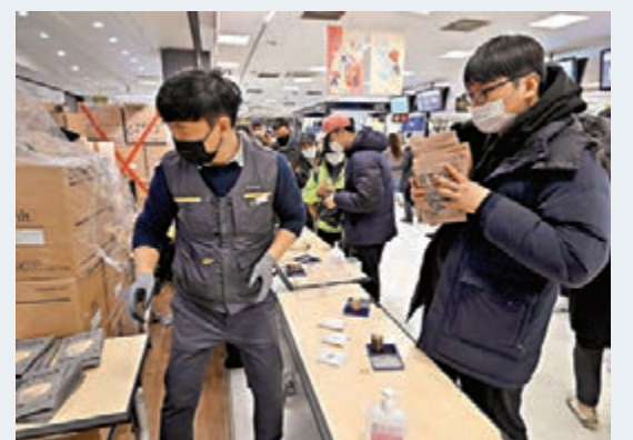
大邱出現口罩搶購潮。

產量、出貨量、出口量及存量，若有銷售商向零售商每日售出超過1萬個外科口罩，同樣需要申報。生產商另外需要將每日口罩產量的最少50%，供應予韓國郵政、農協等公營零售商。綜合報道