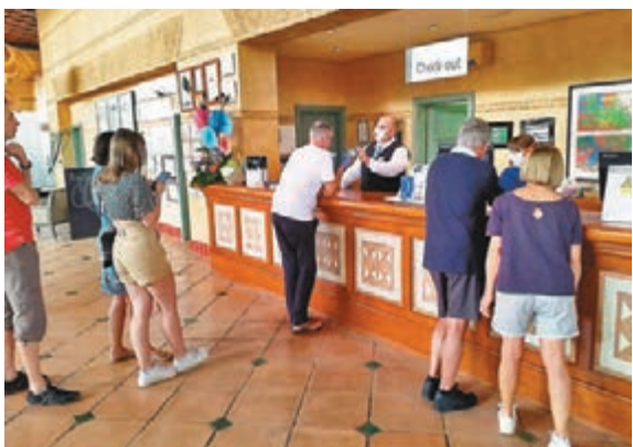
特內里費島有大批旅客滯留在出現病例的酒店內。

胡恩批評，酒店整個上午均沒為住客送餐，資訊發佈亦嚴重不足，他和女友只能以少量零食和飲品充飢，「沒人告訴我們發生什麼事，這會維持多久，我們會吃什麼，被人如此對待，簡直是侮辱。」胡恩抱怨隔離生活沉悶，稱酒店的電視只提供一個英語頻道，又形容酒店現時如同鬼屋，「我怕在這待得愈久，便愈有可能受感染。」綜合報道