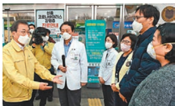
文在寅昨日到大邱視察。