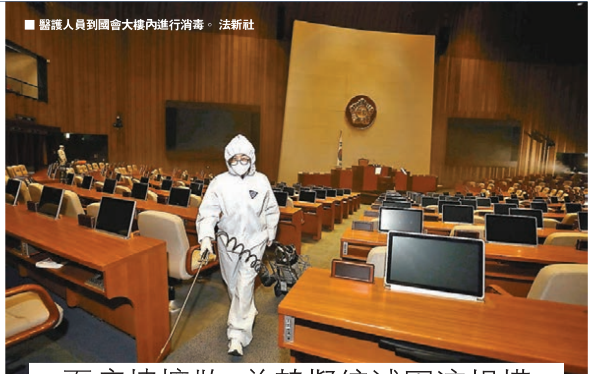
醫護人員到國會大樓內進行消毒。