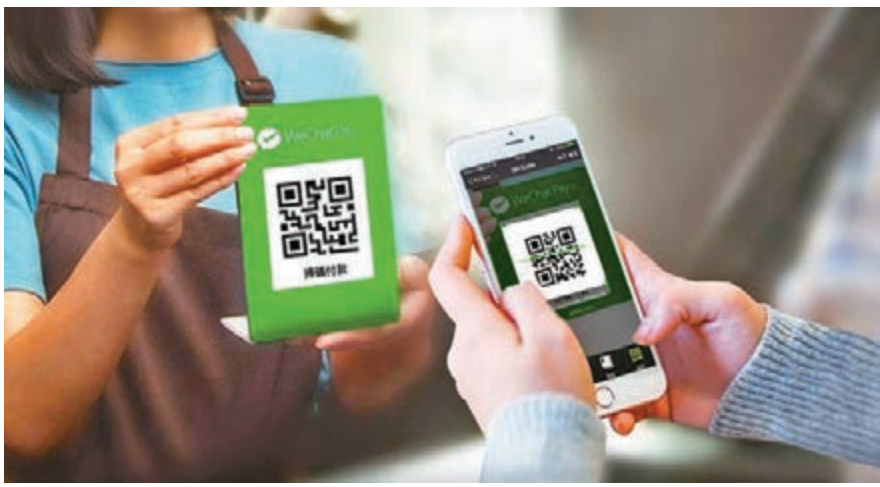
市民將可在澳門商戶用WeChat Pay HK。

自電子錢包在全國各地普及後，港人赴內地用現金消費就似乎顯得有些格格不入。而由於內地對外匯管制較為嚴格，即使是WeChat Pay 和支付寶進軍香港，也是分拆成境內外兩個獨立業務營運，始終在跨境支付方面有很多限制。因此，港人直接使用內地版的WeChat Pay或支付寶，無疑是較用香港版