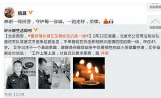
姚晨感謝一線民警，守護每一座城。