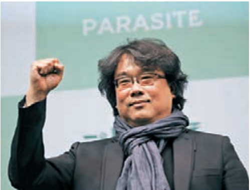
奉俊昊對戰勝新冠肺炎疫情充滿信心。

在《上流寄生族》勇奪奧斯卡四項大獎包括最佳原創劇本、最佳國際電影、最佳導演以及最高榮譽的最佳電影之後，奉俊昊、宋康昊於近日再度訪問日本，在東京召開《上流寄生族》新聞記者會。其間，有記者提問曾執導過《韓流怪嚇》的奉俊昊如何看待當下的新冠肺炎疫情。奉俊昊說：「在病毒侵入人體之前，人們在內心製造了更大的恐懼和不安。如果被捲入這種恐懼心理，我們將很難戰勝這次的災難。與漢江怪物不同，我們現在的情況是：病毒實際存在。但如果我們對此過度反應，再出現對國家、人種的偏見/歧視的話，將引起更加恐怖的事情。」奉俊昊最後表示，他對克服疫情抱有希望，認為「我們就快克服這次的難關了。」