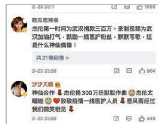
網民指周杰倫踴躍捐獻。