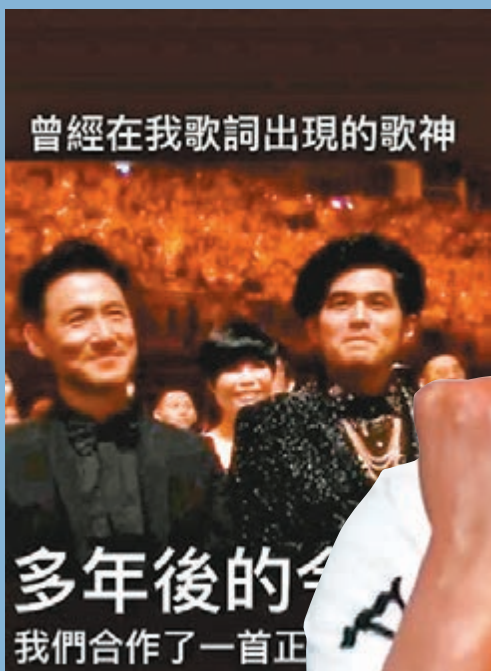
周杰倫與張學友同框。

等風雨經過 等我們相見 你微笑仰望着天 我們一起種下心願 等花開等它實現 該流的淚還是滑過你的臉 我始終在你身邊 說好要一起走很遠 努力讓未來鮮艷 在愛面前需要什麼字眼 對你的承諾 我一定實現 真正的愛不需要有太多語言 有些感動就放在心裡面 在愛面前需要什麼字眼 付出的瞬間也就是永遠 每天離希望又再 靠近了一點 守護家園是最美畫面 我們為愛奉獻 為夢改變