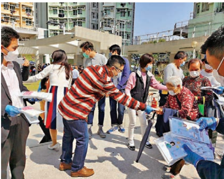
港區省級政協委員聯誼會及其屬會香港政協青年聯會派發口罩。

據悉，該會還將在港島、九龍、新界等地繼續展開基層派口罩活動，盡最大努力幫助基層有需要的人，並積極廣泛團結社會愛心人士，共同做好此次防疫抗疫工作。