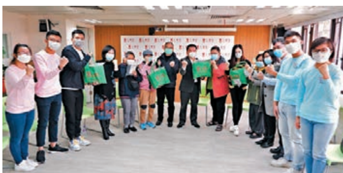
仁愛堂向老友記贈送防疫愛心福袋。

香港文匯報訊（記者 子京）仁愛堂昨日舉行「寒冬送暖防疫關懷」活動，向屬下長者中心會員派送包含口罩、消毒搓手液及健康食品的愛心福袋，為有需要的弱勢社群在寒冬送上溫暖和關愛。