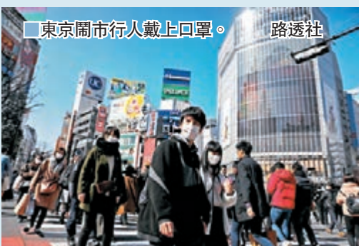
東京鬧市行人戴上口罩。

日本昨日新增13宗病例，連同「鑽石公主號」郵輪，累計確診增至851宗。當地很多個案都屬於社區感染，但至今每日新增確診總數都維持在10宗左右，未有出現韓國或意大利般大量確診，令人質疑，日本時事通訊社昨日便指出，日本對疑似患者進行新冠病毒檢測的條件相當嚴格，加上私人醫院深怕確診個案會影響運作，紛紛將疑似個案當「人球」踢走，導致接受檢測及確診人數均偏低。