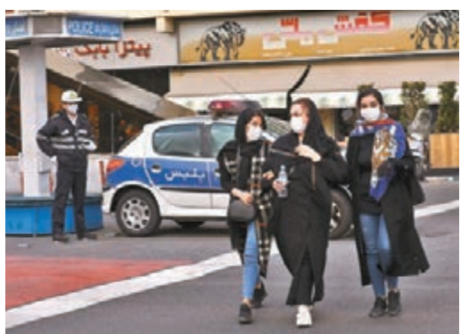
伊朗或成為中東疫情的擴散中心。美聯社

科威特、巴林、阿富汗、伊拉克及阿曼昨日先後出現首批確診，患者全部都是伊朗人或曾經到過伊朗，顯示伊朗已經成為中東地區疫情的擴散中心。伊拉克、土耳其及巴基斯坦紛紛關閉接壤伊朗的陸路邊界，阿富汗也禁止兩國之間的空中及陸上交通，防止疫情湧入。伊朗疫情重災區是十二伊瑪目派聖城庫姆，當地半官方的伊朗學生通訊社(ISNA)昨日報道，庫姆一名議員指控政府掩蓋疫情，透露單是在庫姆，截至2月13日就有50人死亡，這個數字遠多過伊朗官方公佈，亦較伊朗2月16日公佈首宗死亡個案為早。 ■法新社/美聯社/路透社