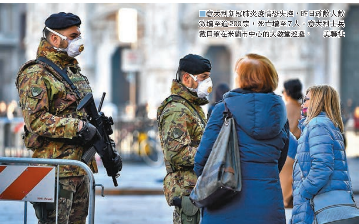
意大利新冠肺炎疫情恐失控，昨日確診人數激增至逾200宗，死亡增至7人。意大利士兵戴口罩在米蘭市中心的大教堂巡邏。