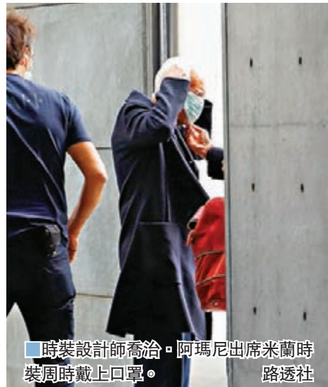
時裝設計師喬洽·阿瑪尼出席米蘭時裝周時戴上口罩。