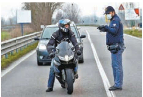
警察在告知司機城鎮的封鎖情況。

此外，一列載有300名乘客的火車前晚由威尼斯前往德國慕尼黑途中，意大利國家鐵路公司向奧地利通報，指車上兩名乘客出現感冒症狀，奧方隨即要求列車停在意大利一方的布倫納山口站，再由奧地利派員為兩人檢疫，直至檢查結果呈陰性才放行。受事件影響，來往意大利至奧地利的列車服務停頓約4小時，之後所有在奧地利下車的旅客都必須接受額外檢查。非洲國家毛里求斯昨日亦宣佈，要求所有來自意大利倫巴第及威尼托大區的旅客接受隔離，意大利航空昨日一班由羅馬起飛的客機，便有多達70名乘客被毛里求斯拒絕入境，需要原機折返。 ■綜合報道