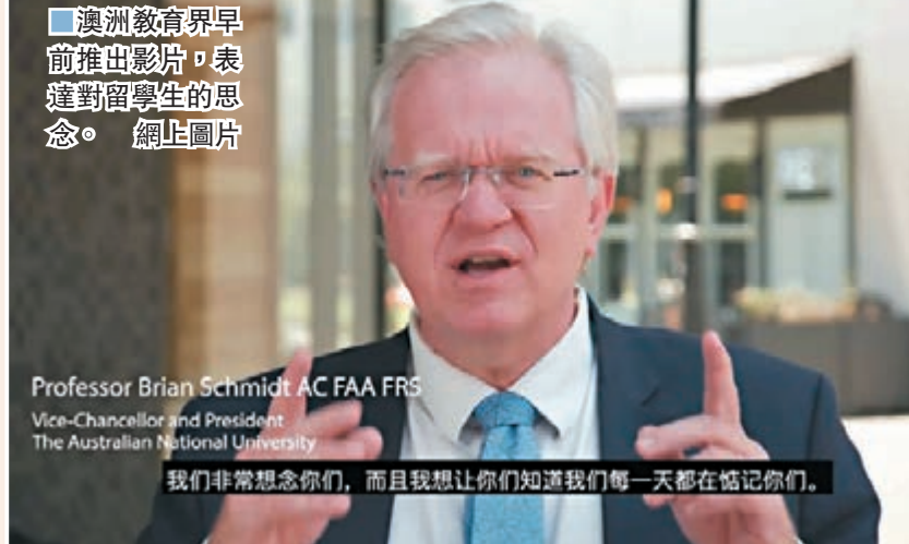
澳洲教育界早前推出影片，表達對留學生的思念。