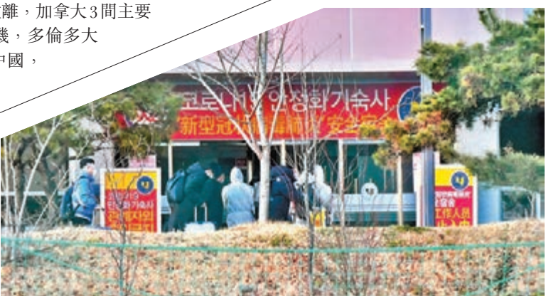
韓國院校為學生設置獨立宿舍。網上圖片

按教育部公佈，韓國現時有約7萬名中國留學生，其中有約3.8萬人尚未返抵韓國，教育部建議尚未購買機票的中國留學生，在春季學期休學，教育部可為相關學生放寬學分修讀限制，另外鼓勵各大專院校互相承認學分，方便留學生在網上選修其他學校課程。