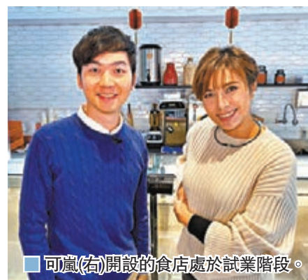
可嵐(右)開設的食店處於試業階段。

盒口罩,點知工人執執吓嘢發現多一盒,感覺開心過執到金!我成日覺得口罩好似救命咁,有命先出得街!」