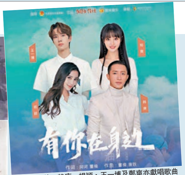
除華仔外,韓庚、楊穎、王一博及鄭爽亦獻唱歌曲《有你在身邊》。