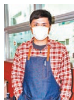
李泳豪指無考慮要求員工放無薪假。