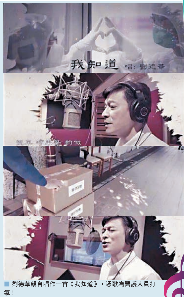
劉德華親自唱作一首《我知道》,憑歌為醫護人員打氣!