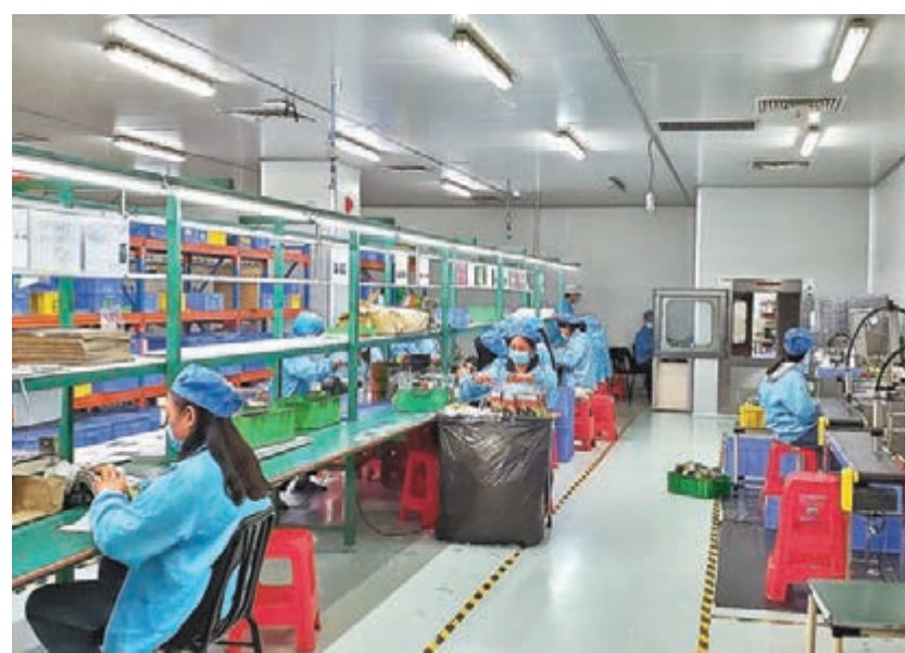
深圳許多高科技企業本周有望迎來全面復工。

香港文匯報訊(記者 李昌鴻 深圳報道)隨着疫情的改善和深圳許多區推出支持復工的舉措,深圳許多高科技企業如康佳、創維、雲天鵬飛等本周將迎來全面復工或者近全面復工,此舉將有利深圳高科技製造業海內外訂單的穩定。