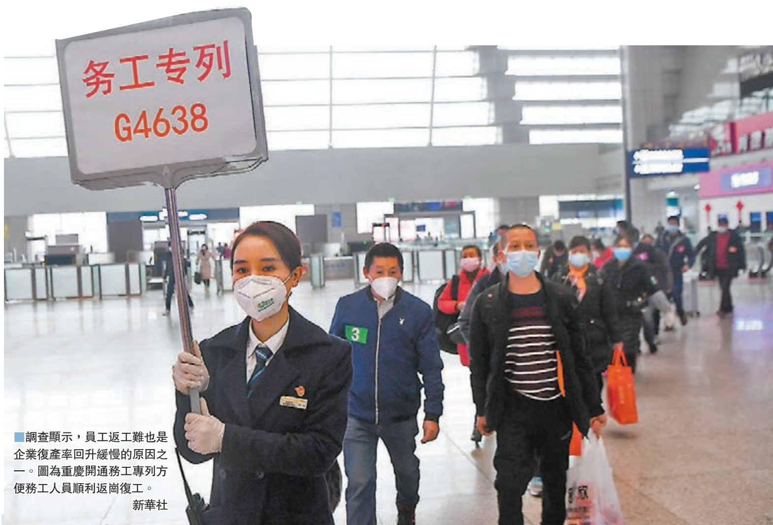
調查顯示,員工返工難也是企業復產率回升緩慢的原因之一。圖為重慶開通務工專列方便務工人員順利返崗復工。

對於企業來說,復工復產亦是當務之急。蘇寧易購集團副董事長孫為民向香港文匯報表示,疫情是企業的壓力測試,要在危機中看到機遇,比如,疫情以來線上蘇寧超市業務翻番增長。現在關鍵是盡快推進科學復工,把失去的時間補回來,還要把應對疫情建立起來的多點辦公、在線工作常態化。