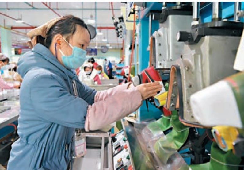
伴隨着疫情的趨穩，部分省份近日已逐漸復工復產。圖為江西南昌某鞋業公司的工人在生產線上製鞋。

米鋒提示，在恢復正常生產生活秩序的同時，還要做好疫情防控工作，盡量減少到人群聚集的場所，減少不必要的外出，必須外出時注意做好個人防護。