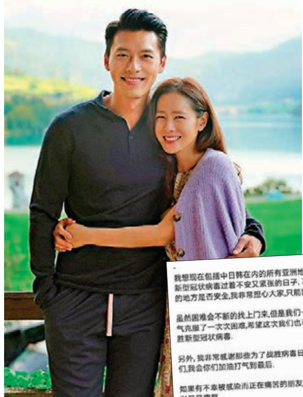
▲玄彬(左)及孫藝珍主演的韓劇《愛的迫降》大受歡迎。 ▲玄彬在信中表示，希望大家盡快戰勝新冠肺炎病毒。

香港文匯報訊 (記者文芬) 新冠肺炎陰霾持續，內地全民共同抗疫，演藝界始終發揮大愛援助，藝人紛紛透過不同渠道，出錢出力，阻擊疫情肆虐。楊冪近日為武漢金銀潭醫院捐出了100萬元人民幣用作購買醫療設備。「星爺」周星馳亦特意發聲為前線醫護加油。韓星玄彬亦以4種語言寫信為病患者打氣。