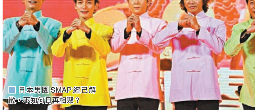
日本男團SMAP已經解散，不知何日再相聚？

於發佈會上，中居正廣向粉絲說明了自己的心情，也道出了退出事務所的原因：「為了接下去在工作上繼續有熱情，我認為我必須改變環境。」對於將來是否將與稻垣吾郎、草薺剛、香取慎吾等人會合，他回應說：「這不是一個人能做到的，當然也不是100%沒可能。」