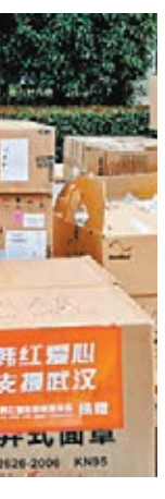
韓紅愛心慈善基金會馳援武漢物資。