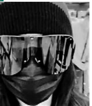
▲周星馳(右)與張栢芝均關心新冠肺炎疫情。