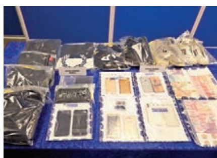
警方展示起回的部分贓物及匪徒犯案時所穿衣物。

他強調，維護社會安寧最重要是市民要有守法意識，警方處理暴力案件不會讓罪法逍遙法外，警方有信心、決心及