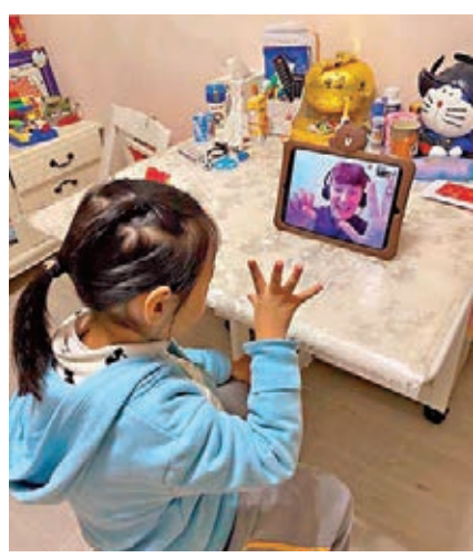
外籍老師幫忙解決功課疑難，令家長大為放心。