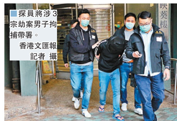
探員將涉3宗劫案男子拘捕帶署。