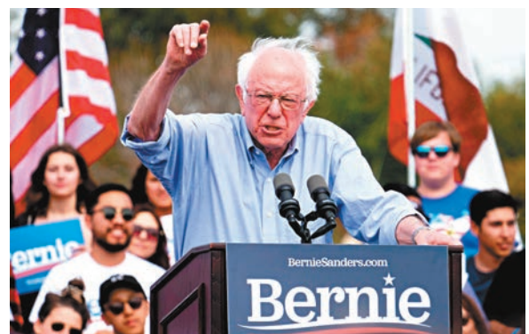
俄國被指暗助桑德斯。

《華盛頓郵報》前日報道，美國情報官員向國會議員的簡報中，指俄羅斯正干預今年年底的美國總統大選，除了幫助總統特朗普連任外，也有意暗中協助佛蒙特州參議員桑德斯勝出民主黨初選。桑德斯證實消息，並警告俄羅斯「遠離美國選舉」。俄羅斯已否認指控。