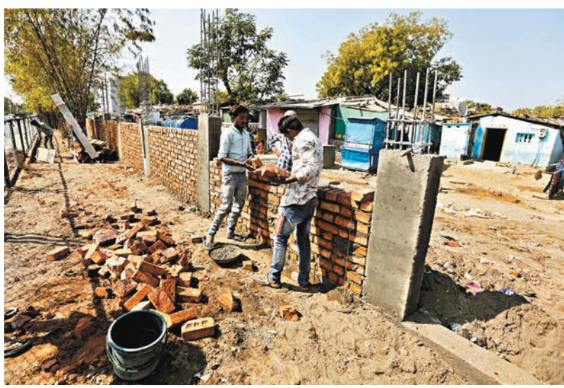
築牆遮擋貧民窟的做法引起爭議。