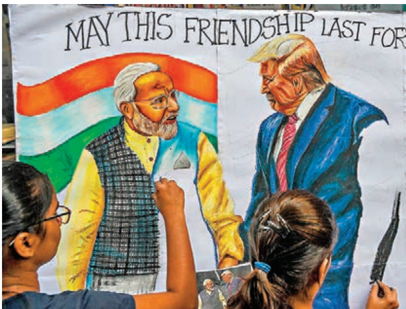
印度學生在街頭畫下美印領袖的肖像。

特朗普與莫迪亦可能敲定美印第3項重要軍事基礎合作協定，「地理空間基本交流與合作協定」(BECA)的簽署時間表。該協定簽署後，將容許兩國交換地理空間地圖資料，以及巡航導彈、彈道導彈等軍事系統與武器的精準度等資料。