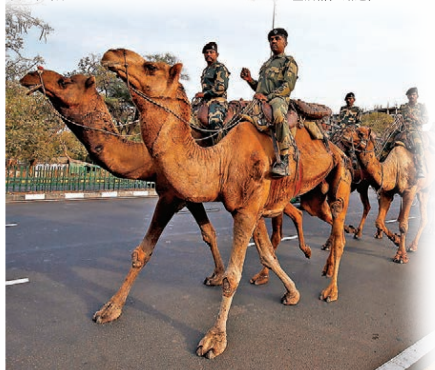
印度軍人騎着駱駝在特朗普的預定行程路線巡邏。