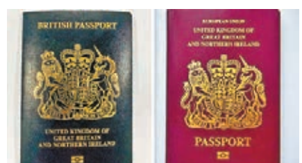
新護照(左)與現時護照(右)。英方在2017年已宣佈，會在脫歐後重新採用傳統的藍色封面護照。

英國在1921年首次使用藍色封面護照，但在1988年為了與歐盟多數國家一致，因此將護照封面顏色轉為酒紅色。