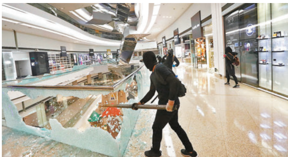
爆發修例風波以來，泛暴派不斷鼓吹及美化暴力，黑衣魔更將暴力日常化，不少青少年在耳濡目染下慘遭洗腦荼毒，守法意識薄弱。圖為黑衣魔縱火後再搗毀商場玻璃。