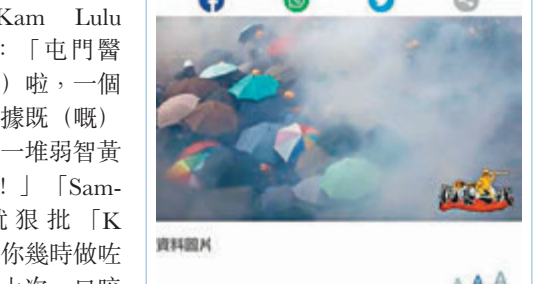
《蘋果》日前未查證就出咗篇催淚彈傷肺報道。

不過，呢啲新聞可能都有佢哋嘅所謂「抗暴之戰」嘅作用，睇下《蘋果》同K Kwong 個post 嘅留言，幾多人話要「追究到底」、「此仇必報」，明晒。