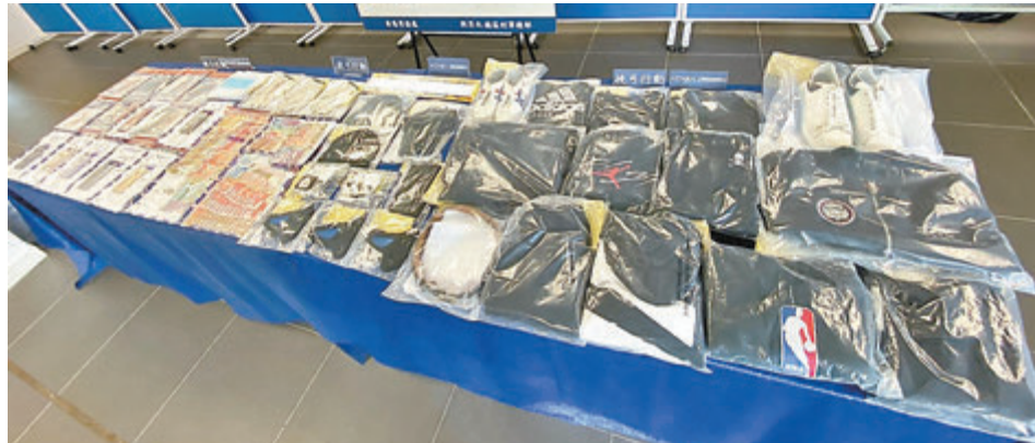
警方進行代號「挽弓」行動，先後拘捕14名涉案疑犯，並檢獲大批證物。

被捕的14人年齡由13歲至35歲不等，部分有黑幫背景，當中1名35歲男子是集團主腦，兩名男子則是骨幹成員，其餘11名男女則是負責落手執行打劫行動的行動組成員，他們分別報稱無業、學生、運輸工人及貨車司機等，當中更有達6人是未滿18歲