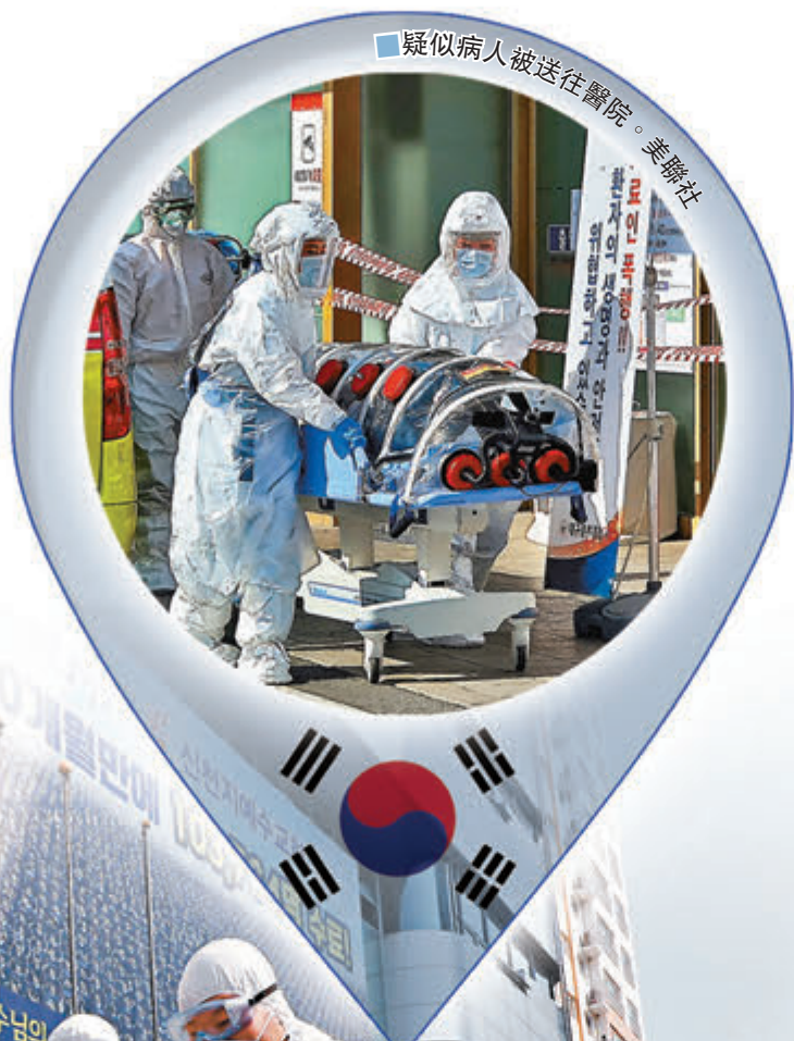
疑似病人被送往醫院。