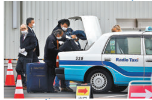
郵輪乘客坐的士離開。

另一方面，日本其他地區昨日再錄得8宗新病例，使全國確診個案增至726宗，其中沖繩昨日錄得第3宗個案，患者不曾接觸「鑽石公主」號郵輪乘客，是當地首名與郵輪無關的個案。 ■綜合報道