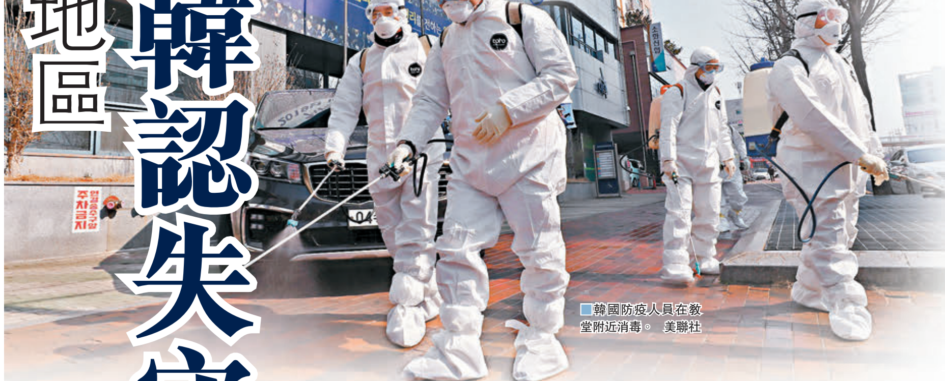
韓國防疫人員在教堂附近消毒。

韓國的新冠肺炎疫情近日急劇惡化，昨日大幅新增53宗確診個案，大部分來自大邱市及慶尚北道，並與早前有女教友確診的大邱新天地教會有關，全國累計確診病例達104宗，成為繼中國內地及日本「鑽石公主」號郵輪後，疫情第三嚴重的地區，並首次有患者死亡。韓國政府坦言疫情已被攻破防線、進入社區傳播階段。