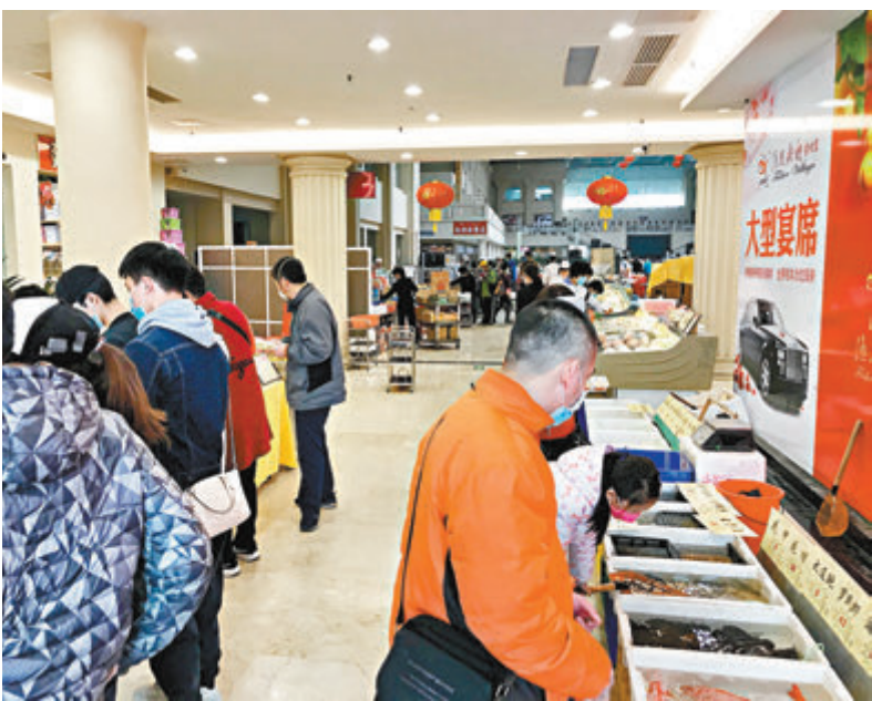
■廣州餐飲名店漁民新村為自救，在大堂內擺攤賣菜，生意不俗。

廣東省疫情防控指揮部辦公室疫情防控組副組長耿慶山介紹，新制定的廣東省餐飲服務業新冠肺炎疫情防控工作指引，對疫情期間能提供堂食服務、餐飲服務的基本要求、從業人員管理、用餐人員管理、場所清潔消毒、原材料採購驗收、加工管理、設備管理、供餐服務要求等方面進行了指引。對於分區分級防控工作指引中的Ⅲ級防控區的縣（區）試點餐飲企業限制堂食服務，分級為Ⅳ級防控區的縣（區），餐飲經營單位可以開放堂