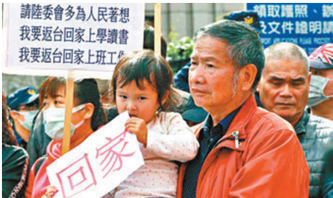
■滯留湖北台胞親屬向台當局請願，希望盡快接家屬回台灣。

陳情呼籲書介紹說，滯留湖北的台胞來自台灣本島及金門的19個縣市，其中新北市約有260人，台北市、桃園市各超過100人，台中市、高雄市各有近100人。他們也呼籲相關縣市能急民所急，為民請命，「幫我們發出聲音」。