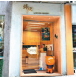
謝霆鋒的「鋒味」店結束門市。