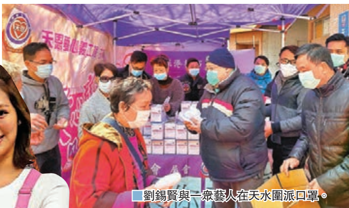
▶劉錫賢與一眾藝人在天水圍派發口罩。