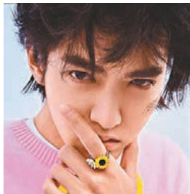
▶黃致列向中國捐款3千萬韓圓。網上圖片