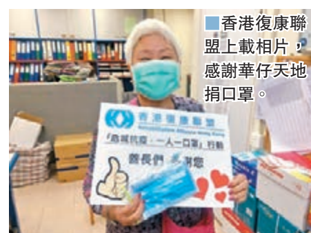
▶香港復康聯盟上載相片，感謝華仔天地捐口罩。

香港復康聯盟發文表示：「我們獲劉德華歌迷會『華仔天地』捐贈3,000個口罩，支持我們正在進行的『危城防疫，一人一口罩』行動，衷心感謝他們的支持，我們會繼續安排，把籌集所得的口罩，轉贈予有需要的殘疾人士。我們很開心第一位的殘疾會員已成功領取口罩。」 另一方面，華仔的官方網頁轉載了主辦單位有關早前宣佈取消香港紅館共12場演唱會的退款事宜，並再次向所有支持和愛護劉德華的已購票人士致歉，亦感謝大家的體諒與耐心等待。據退款安排公告所指，主辦單位於2月24日起，以電郵個別發送「郵寄辦理退票退款表格」予「已登記換票人士」，同時主辦單位會支付每位成功以郵寄方式辦理退款的「已登記換票人士」一律一次港幣35港元郵資補貼（不論任何地區或退票數量），申請退款期限至今年4月30日止，而退款額將於本年6月30日或之前退還。