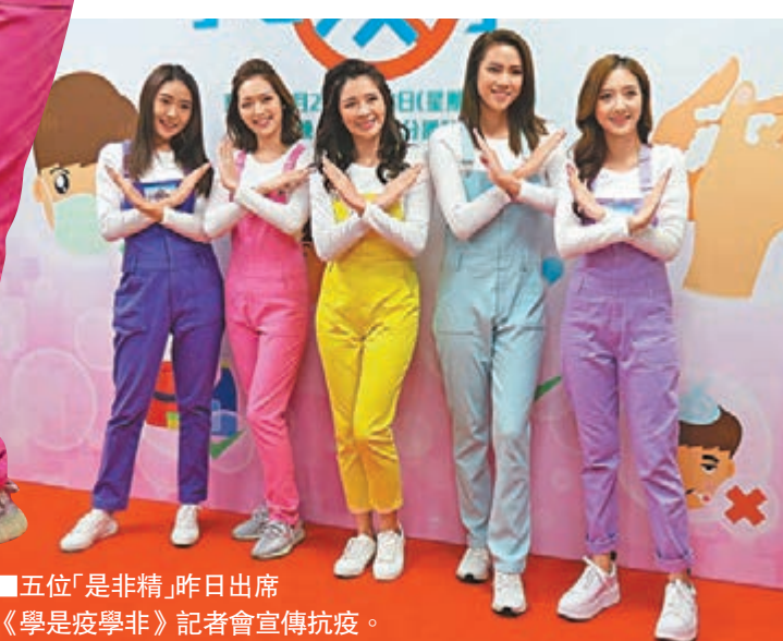
▶五位「是非精」昨日出席《學是疫學非》記者會宣傳防疫。