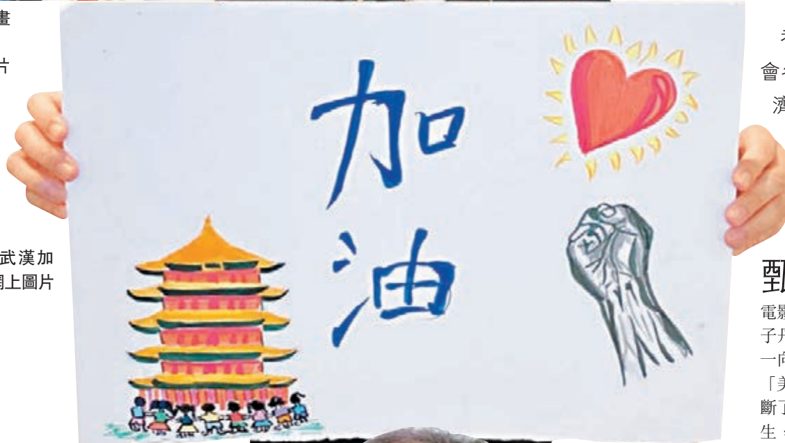
▶甄子丹為武漢加油打氣。

香港文匯報訊（記者 文芬）儘管新冠肺炎疫情仍嚴峻，大家團結抗疫的心仍熱。社會各界繼續積極向疫區提供各種捐贈和幫助，演藝界人士雖然也面臨許多困難，未來的經濟環境未必好，但都盡力支援，發揮積極的正面影響。國際巨星甄子丹亦低調地向武漢慈善總會抗疫前線捐款100萬港幣，以支持醫務人員抗疫工作，並與女兒甄濟如、兒子甄濟嘉，一起畫畫呼籲力挺武漢，一起為武漢加油。而韓國男歌手黃致列亦向中國捐款3千萬韓圓（約19.58萬港元）抗疫。