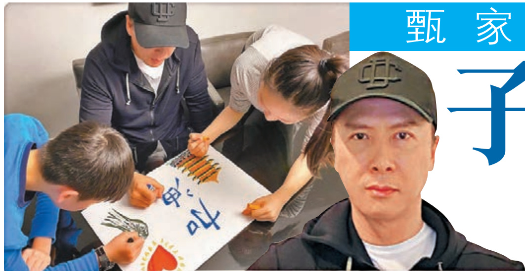
▲甄子丹攜兒女畫畫為武漢打氣。網上圖片