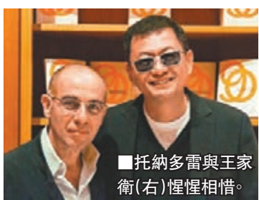
■托納多雷與王家衛（右）惺惺相惜。

天奴、貝納多·貝托魯奇、奇連·伊士活及布魯斯·斯普林斯汀等。托納多雷說：「我希望這部紀錄片不僅可以向世界各地熱愛埃尼奧音樂的觀眾們展現埃尼奧的人生，而且通過他作曲的電影片段，讓所有觀眾都愛上這位20世紀首屈一指，廣為人熱愛的音樂家。」 意大利電影配樂大師埃尼奧對電影配樂史有著革命性的貢獻，迄今為止他創造了超過500首電影及電視配樂，2007年被授以第79屆奧斯卡終身成就獎；2016年憑