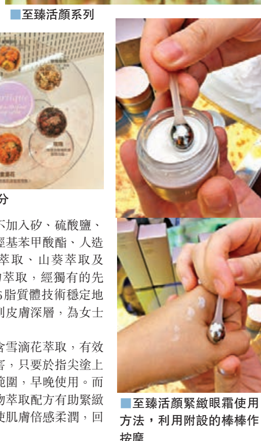
至臻活顏緊緻眼霜使用方法，利用附設的棒棒作按摩

系列當中，如至臻活顏緊緻眼霜，含雪滴花萃取，有效減少黑色素的形成，保護肌膚免受侵害，只要於指尖塗上少量眼霜，輕輕並均勻地塗抹於眼周範圍，早晚使用。而至臻活顏極致修護精華，其獨特的植物萃取配方有助緊緻肌膚，可減少細紋皺紋，均勻膚色，使肌膚倍感柔潤，回復年輕狀態。