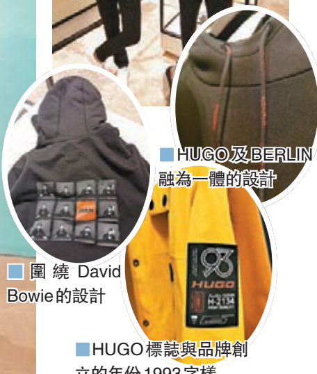
HUGO及BERLIN融為一體的設計