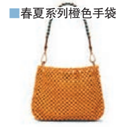
春夏系列橙色手袋