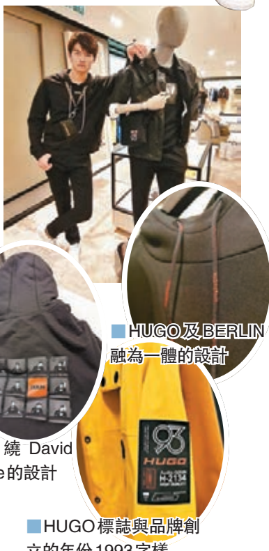
HUGO標誌與品牌創立的年份1993字樣