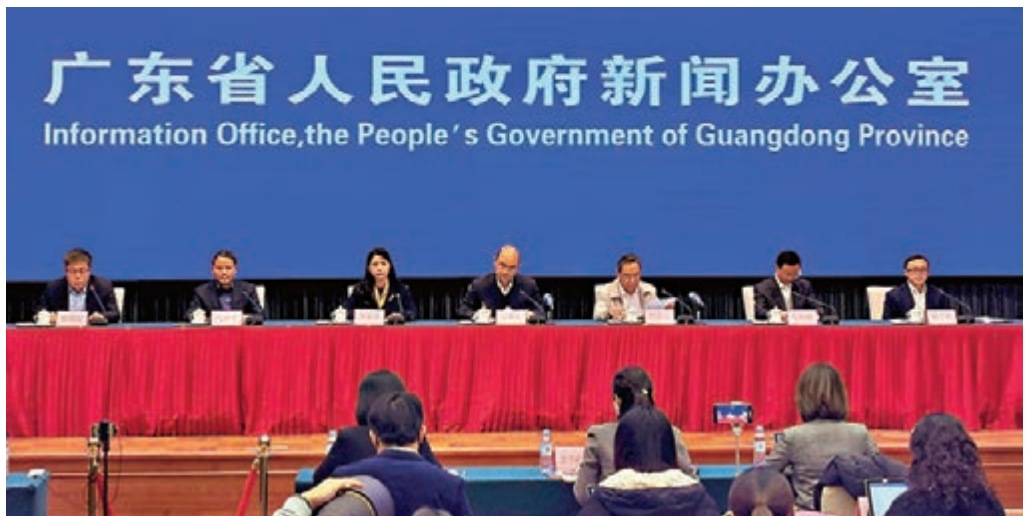
昨日，廣東省人民政府新聞辦召開疫情防控新聞發佈會。

香港文匯報訊（記者 帥誠、方俊明 廣州報道）新冠肺炎疫情發展至今，全國確診病例已經出現下降的趨勢，但八成的病人在武漢，九成死亡病例在武漢及其周邊。國家衛健委高級別專家組組長、中國工程院院士鍾南山指出，西藥在實驗室對新冠病毒有效，然而相當多西藥在進入人體後無效，中藥則不一樣，連花清瘟膠囊等中藥在新冠肺炎臨床治療常用，且使用後顯示能減少病毒進入細胞，減輕炎症症狀，這可以給中藥使用提供一些證據。「我很重視中藥的作用，一旦有證據，中藥是可以放心用的。」