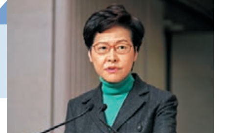
林鄭月娥表示，防疫抗疫基金將加碼至近280億元。

林鄭月娥強調，交給財委會的文件中會說明基金每一項措施的迫切性及執行時間表。由於涉及受惠人數眾多，且每個項目和超過20項措施都有迫切性，誠懇希望立法會議員能夠盡快通過相關撥款。 對部分界別和市民認為自己未能受惠其中，林鄭月娥請他們耐心等待財政預算案的發表，並指財政預算案已經諮詢大眾一段時間，將一如既往地包含一系列刺激經濟、支援業界、「撐企業、保就業」的利民纾困措施。