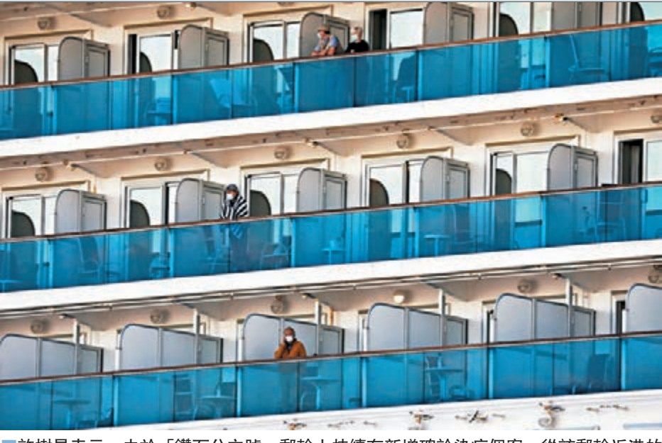
許樹昌表示，由於「鑽石公主號」郵輪上持續有新增確診染疫個案，從該郵輪返港的人屬高風險類別。