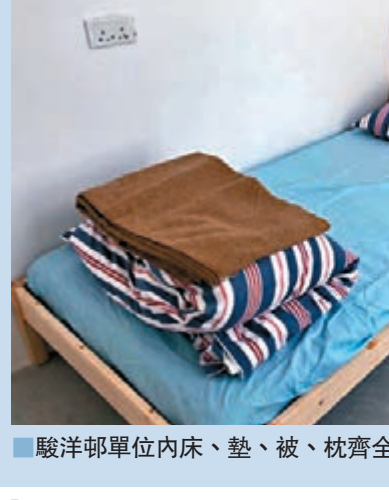
駿洋邨單位內床、墊、被、枕齊全。