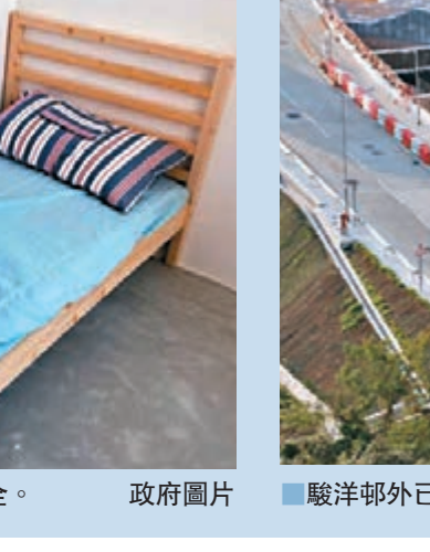
駿洋邨外已加設水馬。