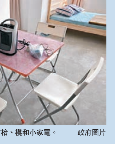
駿洋邨單位內配備有枱、櫈和小家電。