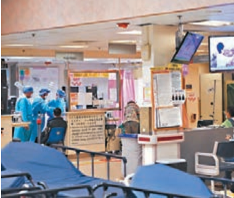
今日起，於急症室和普通科門診的病人，如出現發燒等病徵，需於翌日抽取樣本進行新冠肺炎測試。圖為伊院急症室。

部分新冠肺炎病人數度求診才被確診，增加社區爆發的風險。為了做到早化驗、早隔離，警營局今日起將「加強化驗室監測」，急症室和普通科門診接獲18歲或以上病人時，若對方出現發燒、呼吸道或肺炎病徵，需在翌日自行抽取樣本，送返醫院進行新冠肺炎測試，若結果呈陽性，衛生署會以電話聯絡病人及安排入院；若呈陰性則會透過電話短訊通知病人。警營局會在一星期後檢討計劃流程及成效。