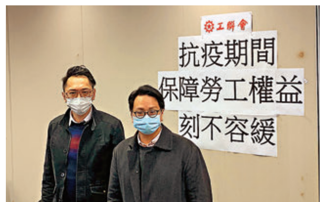
工聯會提出多項建議，保障勞工在防疫期間的權益。