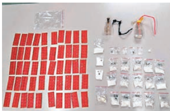
▲探員在酒店房間檢獲的毒品及吸毒工具。

15號棉登大廈有黑社會暗中經營無牌樓上酒吧。油尖警區反三合會行動組經調查後，昨凌晨掩至目標單位外埋伏，趁有人進出時一擁而入，揭發屋內除有人飲酒外，更有約10人圍枱聚賭「魚蝦蟹」。