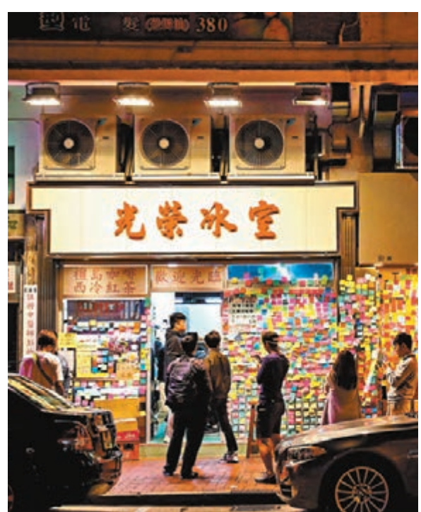
▲光榮冰室跪低仍死撐「夥計落單只能夠用廣東話，亦唔會解釋餐牌意思」。資料圖片