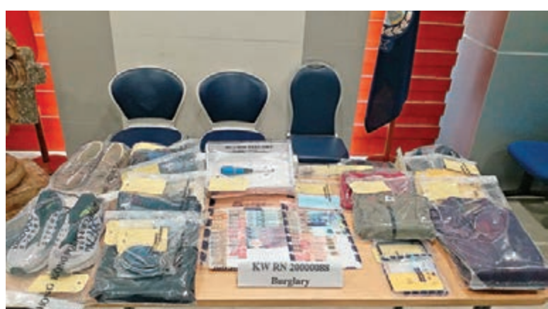
▲警方在被捕男子身上檢獲的作案工具及贓款。

因應最近區內連串爆竊案件有上升趨勢，西九龍總區刑事總部根據線報及經深入調查，於前日上午進行反爆竊行動，探員在油麻地跟蹤一名目標男子，他其後進入佐敦道5號一商業大廈內，探員登樓搜尋，於14樓一間未營業診所外將其