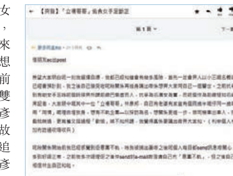
女「手足」在連登控訴林彥邦「噍完鬆」。

呢個女「手足」貼出一封署名「YP LAM」發送嘍郵件截圖，文中字字「懇切」，講到職業嘍束縛令佢嘍（暴力）現場只可以做一個「旁觀者」，又講到自己「欠你們（前線）太多，一直以來都覺得內疚……」